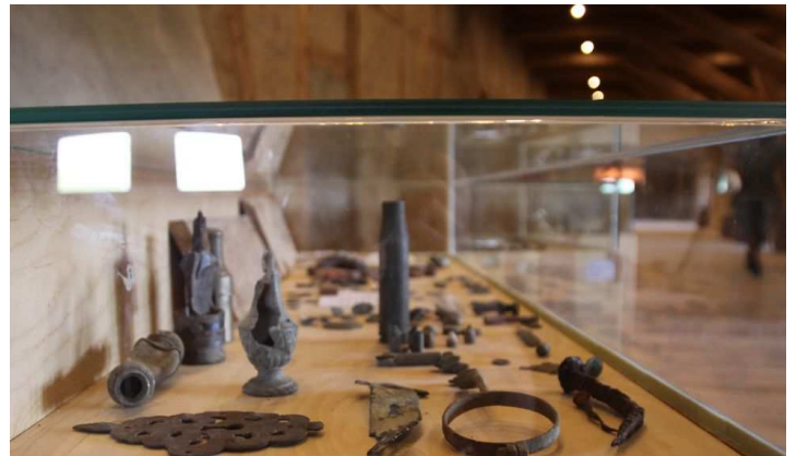
Fragment ekspozycji Uniwersalium Rzemiosł Różnych

Aby zgłębić praktyczną wiedzę na temat dawnych rzemiosł możemy skierować się na ulicę Studzienną, gdzie w XIX-wiecznym „Otwartym Zabytku” poznamy tajemnice architektury ryglowej oraz uczestniczyć w warsztatach artystycznych i rękodzielniczych. Dowiemy się tam jak wyrabiać papier czerpany, ceramikę, makramę i patchwork. „Otwarty Zabytek” czeka na gości codziennie w godzinach 12:00 – 18:00.