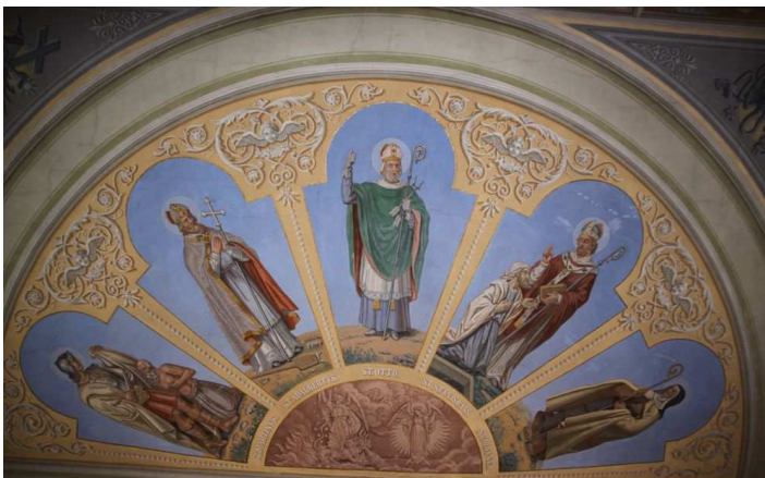
Fragment fresku na suficie Kościoła św. Trójcy

W Czaplunku istnieje możliwość poznać tajemnice templariuszy i ich komandorii, wznoszącej się w XIII wieku w miejscu, gdzie obecnie stoi zabytkowy kościół pw. Trójcy Świętej. Profesjonalny przewodnik opowie również o średniowiecznej starówce i XIX-wiecznym „dużym” kościele. Zwiedzanie „małego kościółka” odbywa się od poniedziałku do piątku w godz. 12:00 – 16:00 (o każdej pełnej godzinie). Szczegóły można uzyskać w Informacji Turystycznej.