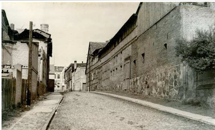
2. Środkowy odcinek ul. Aptecznej na zdjęciu z 1961 roku. W miejscu dzisiejszego bloku mieszkalnego widzimy zabudowania gospodarcze

Co ciekawe, tylko dwie posesje sąsiadujące z ul. Apteczna mają tę ulicę w adresie. Jest to blok mieszkalny opatrzony numerem 2 stojący przy środkowym odcinku ulicy oraz posesja nr 1 znajdująca się po drugiej stronie ulicy naprzeciwko bloku. Cała pozostała zabudowa sąsiadująca z ul. Apteczna przypisana jest do krzyżujących się nią ulic (Jeziornej i Długiej) oraz do ul. Sikorskiego, przy zbiegu z którą Apteczna bierze swój początek. Na narożnej działce przy skrzyżowaniu ul. Aptecznej z ul. Jeziorną trwa budowa dużego domu mieszkalnego. Powstający dom widzimy na fotografii nr 3. Zmieni on krajobraz ulicy, której poświęcony jest ten artykuł, ale w adresie będzie miał ul. Jeziorną.