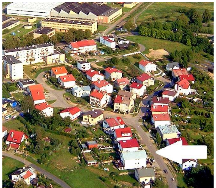
Osiedle 700-lecia. Strzałką zaznaczono ulicę Wasznika (fot. 2001 r.).

polityczna i społeczna Nowej Marchii w średniowieczu (do roku 1535)" na stronach 593 – 600. Jak stąd wynika, Paweł Wasznik został upamiętniony w nazwie czaplincekiej ulicy przez przypadek.