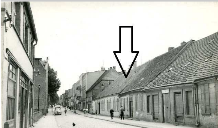
4. Fragment ul. Sikorskiego na zdjęciu z 1961 r. Strzałka wskazuje narożny budynek z apteką, od której pochodzi nazwa ul. Aptecznej.

Inną ciekawostką związaną z ul. Apteczna jest jej obecna nazwa. Jak wiadomo, przy tej ulicy nie ma żadnej apteki. Skąd więc wzięła się taka nazwa? Nazwano ją tak po II wojnie światowej, ponieważ apteka znajdowała się wtedy w parterowym budynku stojącym niegdyś na rogu ul. Aptecznej i ul. Sikorskiego. Budynek ten nie istnieje już od ponad pół wieku. Nazwa tej ulicy jest ciekawym przykładem pokazującym, w jaki sposób nazewnictwo może przyczyniać się do utrwalania i przenoszenia w przyszłość różnych informacji.