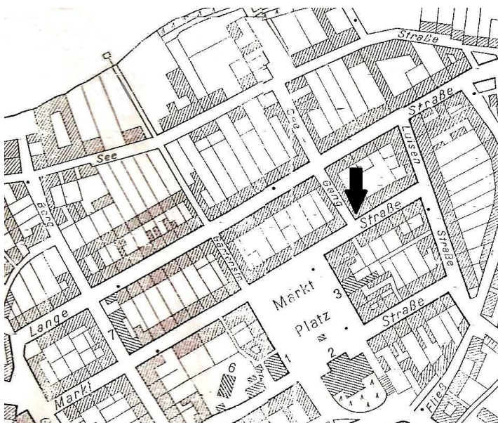
1. Fragment planu miasta z końca lat 30-tych XX w. z widoczną ulicą „See-Gang” - obecną Apticzną. Strzałka wskazuje lokalizację apteki.

Zagadką jest nietypowy przebieg ulicy Apticznej. Zakłóca ona regularność średniowiecznego, kratownicowego rozplanowania miasta. W czaplincekim kompleksie staromiejskim wszystkie uliczki przecinające pod kątem prostym (lub zbliżonym do prostego) główną oś miasta, którą wyznacza ul. Sikorskiego, wytyczone są w ten sposób, że łączą one ul. Długą z ul. Moniuszki, przecinając ul. Sikorskiego lub rynek. Wyjątek stanowi ul. Apticzna. Odbiega ona od ul. Sikorskiego w pewnej odległości od rynku. Regularność staromiejskiego układu wymagałaby, żeby ulica ta wybiegała z narożnika rynku, podobnie jak