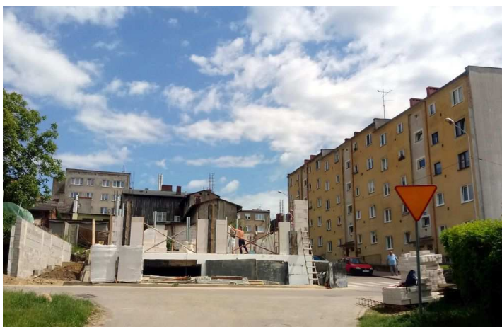
3. Budowa domu mieszkalnego na rogu ul. Aptecznej i Jeziornej. Stan z 2 czerwca 2020 r.

Co ciekawe, tylko dwie posesje sąsiadujące z ul. Apteczna mają tę ulicę w adresie. Jest to blok mieszkalny opatrzony numerem 2 stojący przy środkowym odcinku ulicy oraz posesja nr 1 znajdująca się po drugiej stronie ulicy naprzeciwko bloku. Cała pozostała zabudowa sąsiadująca z ul. Apteczna przypisana jest do krzyżujących się nią ulic (Jeziornej i Długiej) oraz do ul. Sikorskiego, przy zbiegu z którą Apteczna bierze swój początek. Na narożnej działce przy skrzyżowaniu ul. Aptecznej z ul. Jeziorną trwa budowa dużego domu mieszkalnego. Powstający dom widzimy na fotografii nr 3. Zmieni on krajobraz ulicy, której poświęcony jest ten artykuł, ale w adresie będzie miał ul. Jeziorną.