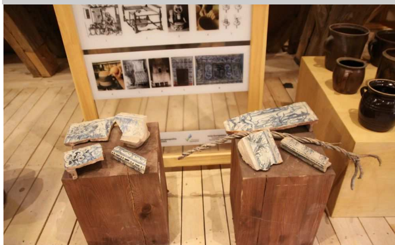
Uniwersalium Rzemioł Różnych