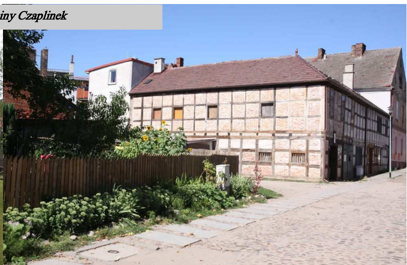
Otwarty Zabytek na ulicy Studziennej