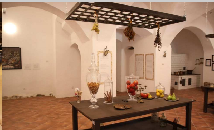
Interaktywne Muzeum Baroku