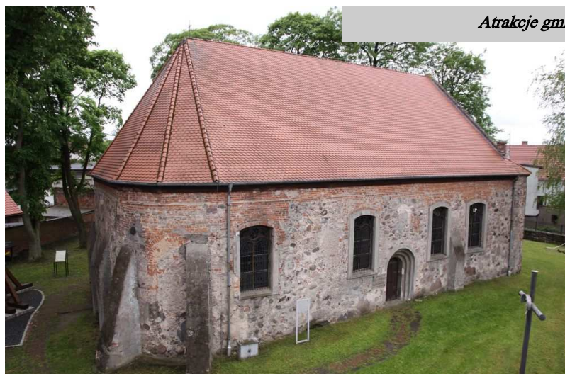
Kościół pw. Św. Trójcy