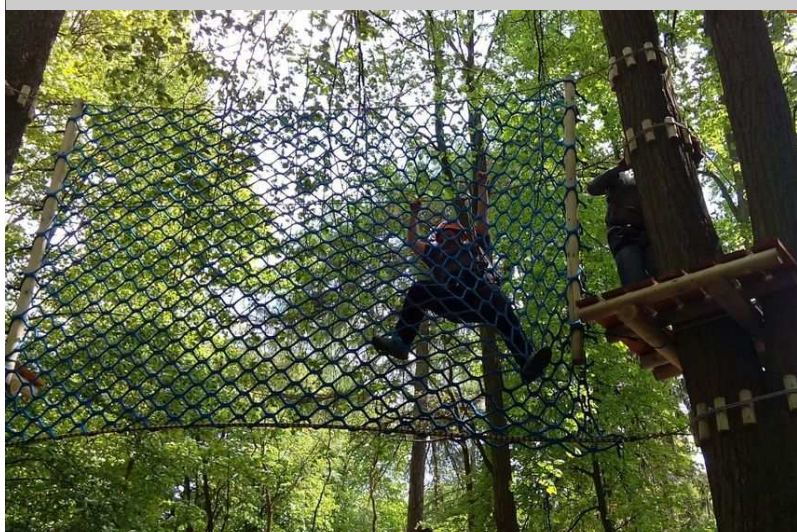
Park Linowy „Linolandia”