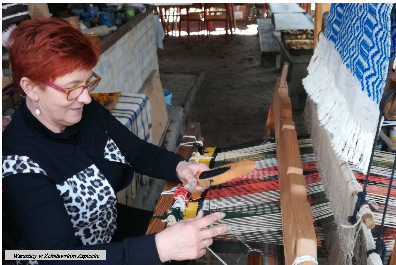
Warsztaty w Żeliszławskim Zapiecku