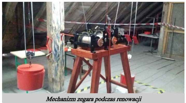
Mechanizm zegara podczas renowacji