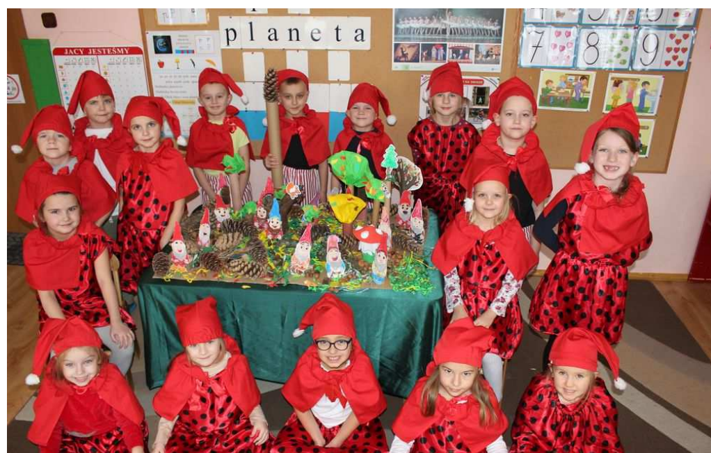
Projekt przedszkolaków „Wielkie czytanie w kole na dywanie”