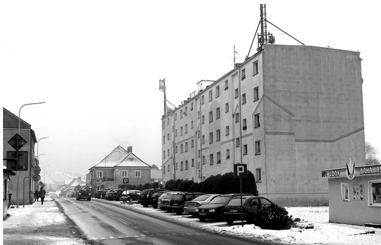
Blok mieszkalny wzniesiony w 1972 roku przy ul. Długiej (2021 r.)