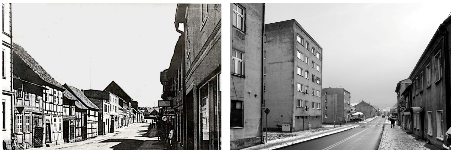
Krajobraz ul. Długiej przed 1945 r. i w 2021 r.

szczecińskiej i oddania w 1983 roku do użytku funkcjonującej do dziś omijającej ściśle centrum trasy przelotowej wiodącej ulicami: Dąbrowskiego, 7 Kołobrzeskiego Pułku Piechoty, Szczecińską i Polną. Obecnie Długa również pełni rolę ulicy przelotowej, ale w stopniu ograniczonym przez znaki drogowe zakazujące wjazdu pojazdów o masie całkowitej przekraczającej 2,5 t z wyjątkiem pojazdów zaopatrzenia, mieszkańców, autobusów szkolnych i służb miejskich.