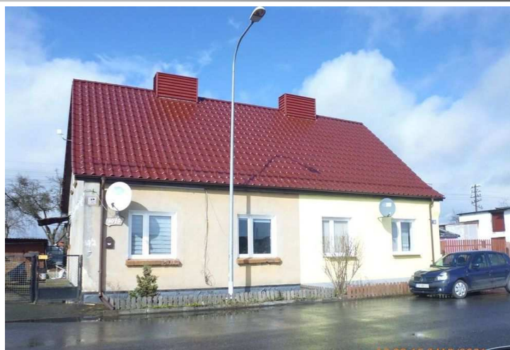
Wspólnota Mieszkaniowa ul. Dworcowa 10 remont dachu