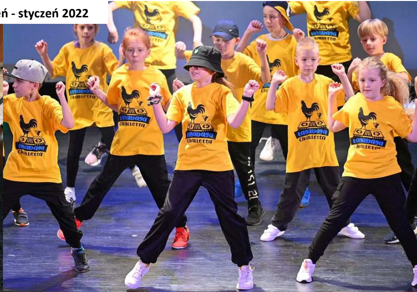
Występ dzieci z czaplineckiej grupy hip-hopowej w Pile