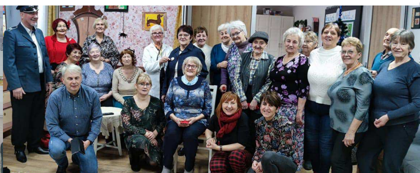
Projekt z udziałem czaplineckich seniorów „Teleporadka Babcie i Dziadka”