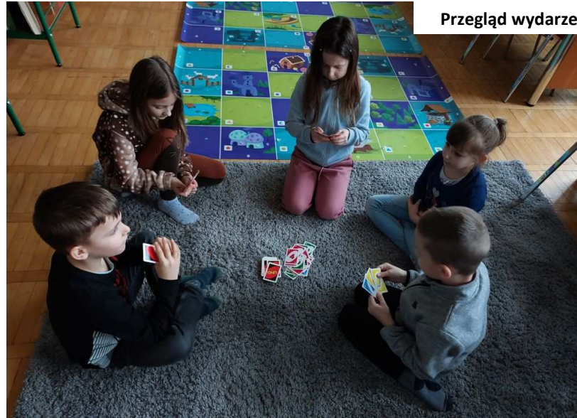
Ferie w Bibliotece Gminnej