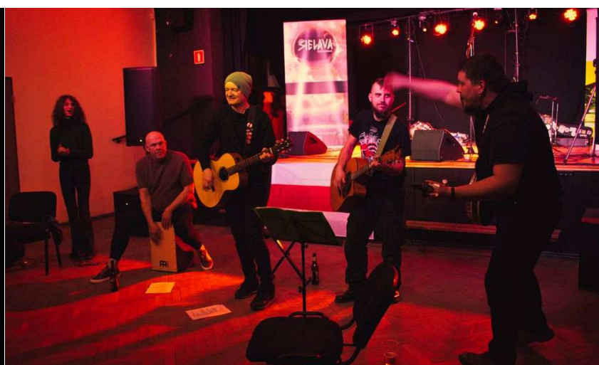
Koncert „Za wolność naszą i waszą”