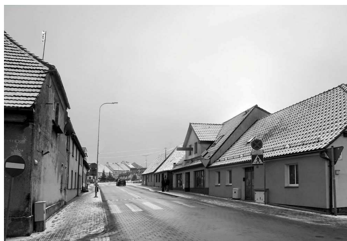
Południowy kraniec ul. Długiej z tradycyjną zabudową (2021 r.)

zjawiskiem w procesie stopniowej zmiany wizerunku tej ulicy. Znajduje się tu teraz znaczna część śródmiejskich punktów sprzedaży detalicznej.