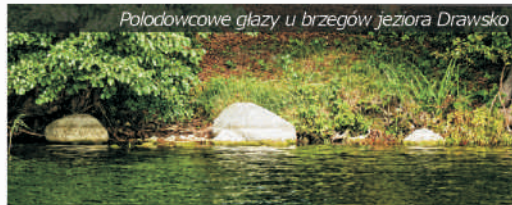
Polodowcowe głazy u brzegów jeziora Drawsko

Gmina Czaplina położona jest w południowo-wschodniej części województwa zachodniopomorskiego , w powiecie drawskim. Zajmuje obszar ok. 365 km 2 i jest zamieszkiwana przez niecałe 12 tys. mieszkańców. Czaplina jest ważnym lokalnie węzłem drogowym, krzyżuje się tutaj droga krajowa nr 20 (Stargard – Szczecinek – Kościerzyna) z drogą 163, łączącą Poznań z Kołobrzegiem oraz dwiema innymi drogami wojewódzkimi. Przez miasteczko przebiega linia kolejowa Szczecinek – Runowo Pomorskie.