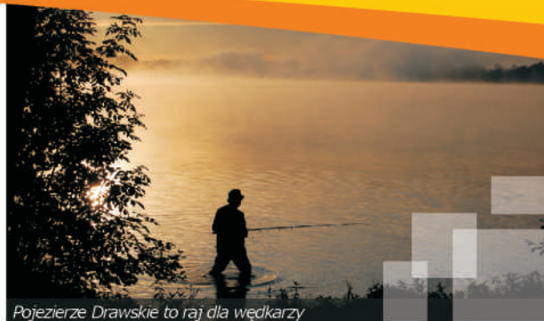
Pojezierze Drawskie to raj dla wędkarzy

Miasto jest także ważnym ośrodkiem przemysłowym regionu. Znajdują się tutaj zakłady elektrotechniczne, tartak, przedsiębiorstwa rolne i wiele mniejszych firm. Czaplinek to także dobra marka – to z nim związane są słynne „Miody Drahimskie” oraz sielawa wędzona , wpisane na listę produktów tradycyjnych województwa. Przy-smaki te, znane już w całej Polsce, a także poza jej granicami, wielokrotnie nagradzane, kojarzone są z czystym środowiskiem całej gminy i okolic.