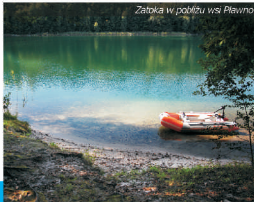
Zatoka w pobliżu wsi Pławno

Zarządcą wód aktualnie jest Gospodarstwo Rybackie w Czaplunku Sp. z o.o. Krzemno jest udostępnione do połowu dla wędkarzy posiadających kartę wędkarską i zezwolenie zarządcy na amatorski połów ryb. Dzięki przejrzystej wodzie, połów ryb nie jest łatwy, gdyż bardzo łatwo jest spłoszyć rybę. Jezioro słynie z pięknych drapieżników – okonia i szczupaka . Pomosty są nieliczne, warto więc rozważyć połów z łodzi, którą można zwodować w kilku miejscach przy północnych brzegach jeziora.