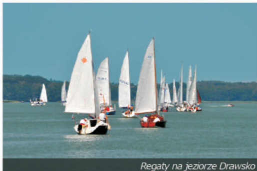
Regaty na jeziorze Drawsko

Czaplinek to centrum turystyki aktywnej . Każdy może tu coś znaleźć dla siebie – jezioro Drawsko to oczywiście żagle, zarówno duże jachty i małe żaglówki, szkółki żeglarskie i deski windsurfingowe. Liczne zatoki, wyspy i długa linia brzegowa tego jeziora to raj dla żeglarzy. Czyste wody sprzyjają nurkowaniu . W odmętach jeziora Kaleńskiego odbywają się mistrzostwa Polski w łowiectwie podwodnym, innych zaś pociągają głębokie tonie i kamienne rafy jeziora Drawsko.