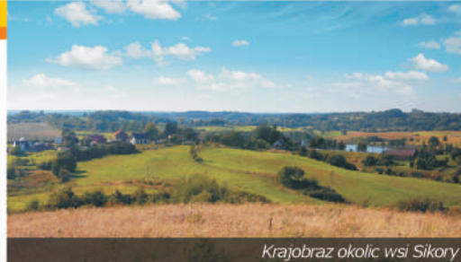
Krajobraz okolic wsi Sikory

Na skraju jeziora Komorze znajdują się Sikory , pięknie ulokowana wieś z osadą ceramiczną i piecem do wypalania ceramiki. Na południe od Czaplinka leżą Broczyno i Machliny , położone nad jeziorami. W ich pobliżu zachowało się kilka uroczych pałaców i dworów, zaś niedaleko Machlin rozciągają się przepastne Bory Krajeńskie, pełne jagód i grzybów. Na zachód od miasta, nad zatoką jeziora Drawsko, znajduje się Siemczyno z efektywnym, barokowym pałacem rodu von Goltz.