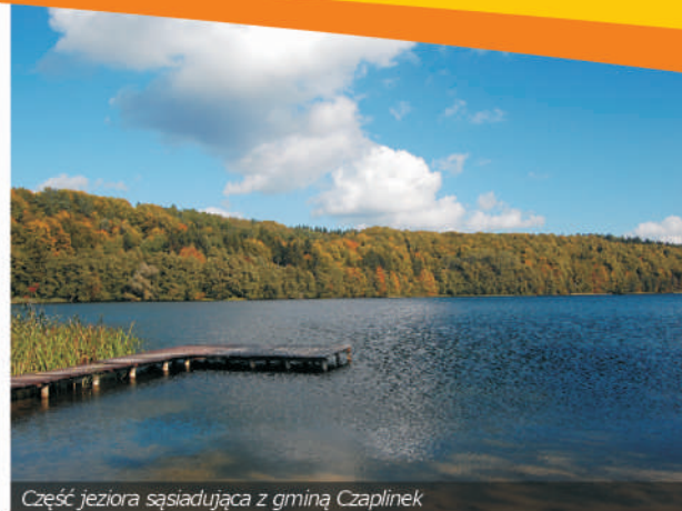
Część jeziora sąsiadująca z gminą Czaplonek

Komorze jest obecnie wykorzystywane turystycznie w niewielkim stopniu, choć jest jednym z najczystszych jezior ziemi czaploneckiej. Mimo dużej powierzchni, brak jest jakiegokolwiek infrastruktury dla żeglarzy i innych wodniaków.