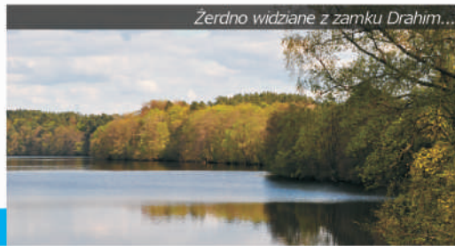
Żerdno widziane z zamku Drahim...

Linia brzegowa w większości jest zarośnięta pasem olsz, trzcinowiska są nieliczne. Strome brzegi sięgają do ponad 80 metrów nad lustro wody. ( Spyczyna Góra koło Żerdna). Nad jeziorem leżą trzy miejscowości, Stare Drawsko i dwie niewielkie wsie: Żerdno i Nowe Drawsko. Jest tu zlokalizowany jeden ośrodek wypoczynkowy, w pobliżu którego znajdują się największe głębie tego zbiornika. Jezioro ma stosunkowo niewielką falę i w miarę stałe, zachodnie wiatry. Brak jest mielizn, co czyni ten akwen bardzo dobrym dla chcących się uczyć żeglarstwa lub windsurfingu. Z pobliskim jeziorem Drawsko jest połączone rzeka Drawą, niestety nie jest możliwe przeciągnięcie nią między jeziorami jednostek niewiele większych od kajaków. Na Srebnym można też rozpoczynać spływy kajakowe Drawą. Jezioro ma wody I klasy czystości.