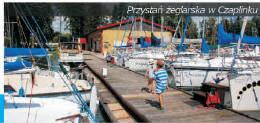
Przystań żeglarska w Czaplinku

Swój niecodzienny kształt zbiornik zawdzięcza lodowcowi – jego topniejące wody, wyrzeźbiły kilka rynien, które skrzyżowały się w miejscu dzisiejszego jeziora Drawsko. Dzięki temu na jeziorze można uprawiać żeglarstwo przy każdym wietrze – z każdej strony zbiegają się długie zatoki, stwarzające wspaniałe warunki dla żaglówek i desek z żaglem. Znaczna rozpiętość powoduje jednak, że wiatr jest na jeziorze bardzo silny, a niebezpieczne fale nierzadko osiągają nawet wysokość jednego metra.