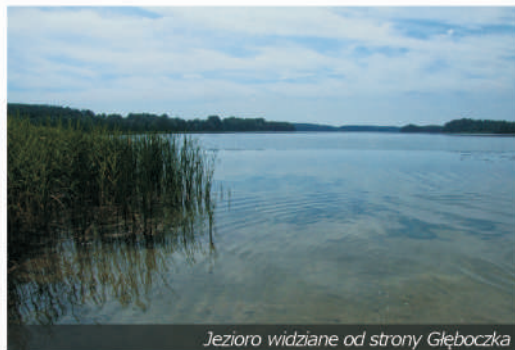
Jezioro widziane od strony Głębozca

Nad jeziorem jest zlokalizowana niewielka, letniskowa miejscowość Głębozeczek , w której znajduje się plaża oraz miejsce, gdzie można bez większych problemów zwodować niewielką łódź lub deskę z żaglem. W pobliżu ujścia Drawy rozpościera się kompleks obiektów wojskowych w Budowie z dwiema wielkimi wieżami . Budynki te powstały w latach trzydziestych XX wieku jako część kompleksu szkoleniowego partii nazistowskiej. Po II wojnie światowej początkowo znajdował się tu jeden z ośrodków szkolenia sportowego przed igrzyskami olimpijskimi w Rzymie, a od lat 50. jest to teren jednostki wojskowej.