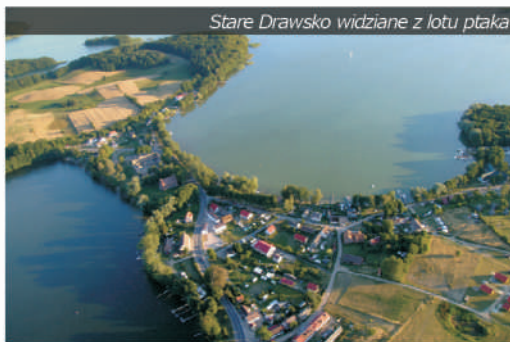
Stare Drawsko widziane z lotu ptaka

Najważniejszą miejscowością jest oczywiście Czaplinek , liczący prawie 7000 mieszkańców, będący siedzibą władz gminy oraz gospodarczym, turystycznym i kulturalnym centrum całego regionu, związanego z jeziorem Drawsko. Na północ od Czaplinka znajduje się Stare Drawsko (pięknie położona wieś letniskowa z górującym nad nią zamkiem Drahim) oraz Kluczewo . Nieopodal Kluczewa, położonego na skraju Doliny Pięciu Jezior i Szwajcarii Połczyńskiej, jest Bolegorzyn, z pierwszym w Polsce muzeum PGR.