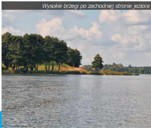
Wysokie brzegi po zachodniej stronie jeziora

Współcześnie jezioro jest wykorzystywane turystycznie w niewielkim stopniu. Niegdyś było bardzo zanieczyszczone, obecnie czyste wody zachęcają do kąpieli lub nauki windsurfingu . Brak jest jednak infrastruktury dla amatorów sportów wodnych.