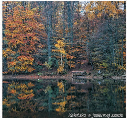
Kaleńskie w jesiennej szacie

Jezioro Kaleńskie jest zarządzane przez Gospodarstwo Rybackie w Czaplunku Sp. z o. o. Aby poławiać ryby należy posiadać kartę wędkarską oraz zezwolenie wykupione u rybackiego użytkownika jezior. Łowi się tu najczęściej szczupaka, lina oraz leszcze. Pomosty są nieliczne, warto więc zabrać ze sobą łódkę.