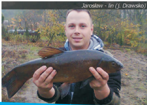
Jarosław - lin (j. Drawsko)