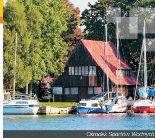
Ośrodek Sportów Wodnych

Nad brzegami jeziora Drawsko leży kilka miejscowości, ale główną bazą wypadową jest Czaplinek , gdzie znajduje się Ośrodek Sportów Wodnych i liczne ośrodki wypoczynkowe. Drugą ważną miejscowością jest Stare Drawsko . Nad jezioro można też dostać się od strony Siemczyna i Piaseczna, gdzie jest zlokalizowany jeden z kempingów oraz od północy z miejscowości Uraz. W Czaplunku i Starym Drawsku powstały bazy żeglarskie. Także i tam zaczyna się większość spływów kajakowych. Jezioro, pomimo, że połączone Drawą z jeziorami Żerdno i Rzepowskim oraz Czaplinceką Strugą z Czaplinem, jest samodzielnym akwenem żeglarskim (aktualnie nie ma możliwości przedostania się jachtami na inne zbiorniki wodne). Pływacze chętnie nurkują w pobliżu zatoki Pięciu Pomostów - tam mniej więcej znajduje się najgłębsze miejsce jeziora. Najładniejsze plaże znajdują się w Czaplunku w zatoce Plaża, w Starym Drawsku i Siemczynie, ale dogodne miejsca do kąpieli można znaleźć na prawie każdym kilometrze brzegu jeziora.