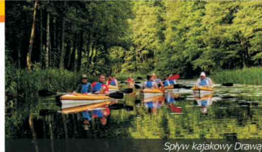
Spływ kajakowy Drawą

Kilkanaście tysięcy lat temu, gdy lodowiec opuszczał te tereny, wielkie masy lodu, topniejące wody i zagarnięty z całej Szwecji materiał skalny kształtowały obecny krajobraz ziemi czaplinskiej. W dawnych, polodowcowych rynnach istnieją obecnie jeziora , w tym niezwykle, powstałe z połączenia kilku takich rynien, jezioro Drawsko.