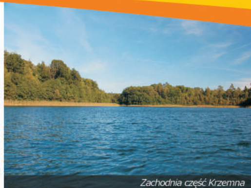
Zachodnia część Krzemna

Jezioro jest bardzo dzikie, brak nad nim jakichkolwiek ośrodków wypoczynkowych i osad ludzkich (poza zbliżającym się powoli od wschodu Pławnem). Woda jest bardzo przejrzysta, nawet do 5 metrów, dno piaszczyste. Jezioro ma wody I klasy czystości i należy do zbiorników lobe-liowych. Krzemno jest w niewielkim stopniu wykorzystywane do celów turystycznych z powodu braku jakiegokolwiek infrastruktury i braku dogodnego dojazdu. Dzięki przejrzystej wodzie jest bardzo atrakcyjne dla płetwonurków, którzy często korzystają z uroków podwodnego świata tego jeziora, także polując tutaj z kuszą.