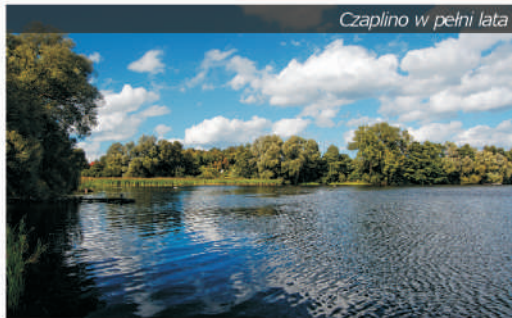
Czaplino w pełni lata

Czaplino znajduje się pod zarządem Gospodarstwa Rybackiego w Czaplunku Sp. z o.o. Dzięki licznym kładkom, ulokowanym wokół jeziora, jest ono łowiskiem łatwo dostępnym dla wędkarzy. Niezłe efekty osiąga się łowiąc tu leszcze, okonie i płocie.