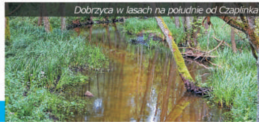
Dobrzyca w lasach na południe od Czaplina

Rzeki , na czele z najpiękniejszą dla wielu kajakarzy rzeką Pomorza – Drawą połączyły te jeziora i płynęły na południe, do doliny Noteci. Łącznie wody zajmują aż 10% powierzchni gminy, a do najpiękniejszych jezior należą: Drawsko, Żerdno, Kaleńsko, Krzemno, Czaplina i wiele innych, w tym także Komorze, znajdujące się na granicy gminy. Ogółem, na terenie gminy Czaplina jest aż 47 jezior o powierzchni większej od 1 ha. Drugą większą rzeką, płynącą przez ziemię czaplinską, będącą również szlakiem kajakowym, jest Dobrzyca.