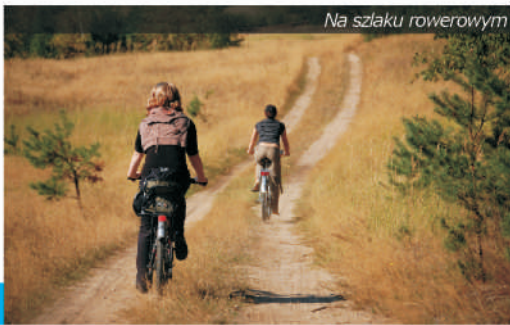
Na szlaku rowerowym

Oprócz nurków nad jeziorami przez cały rok spotkać można wędkarzy – to znak, że wody są zasobne w ryby. Prócz nich z wód jezior i rzek korzystają kajakarze – w Czaplinku zaczyna się szlak kajakowy rzeką Drawą im. ks. kard. Karola Wojtyły, który także tutaj pływał kajakiem. Urokliwe okolice sprzyjają rowerzystom . Obok nich, często na tych samych ścieżkach, spotkać można osoby z kijkami, uprawiające nordic walking . Z innych szlaków korzystają jeźdźcy na koniach, także aktywnie spędzający czas na łonie przyrody. Amatorzy grzybów i jagód wybierają się na spacer do przepastnych borów koło Machlin.