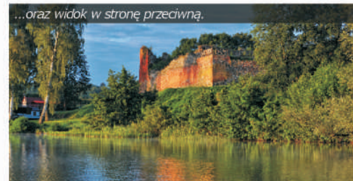
...oraz widok w stronę przeciwną.

Prawdopodobnie jeszcze półtora tysiąca lat temu, jezioro to było zatoką pobliskiego jeziora Drawsko. Gdy ówcześni mieszkańcy ziemi czaplineckiej, zaczęli budować grody, dostrzegli walory obronne miejsca, na którym obecnie znajduje się zamek Drahim . Jezioro zostało częściowo zasypane, zaś z głazów i ziemi usypano pagórek, na którym zbudowano gród.