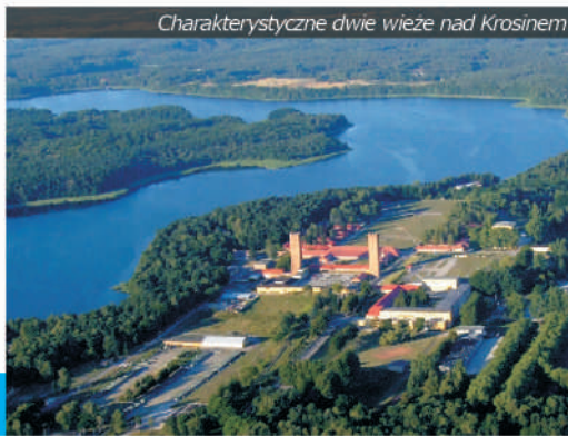
Charakterystyczne dwie wieże nad Krosinem

Obecnie jezioro Krosino jest zarządzane przez Gospodarstwo Rybackie w Czaplunku Sp. z o. o. i jest udostępnione do połowu dla wędkarzy posiadających kartę wędkarską po wykupieniu zezwolenia na połów ryb u rybackiego użytkownika jezior. Jest to jezioro leszczowe, z występującym tutaj także linem, pięknym węgorzem (zwłaszcza w pobliżu wpływu Drawy) i drapieżnym szczupakiem. Pomimo, że Krosino jest niemal całkowicie ukryte wśród przepastnych lasów, wzdłuż brzegów można znaleźć liczne kładki, umożliwiające połów ryb.