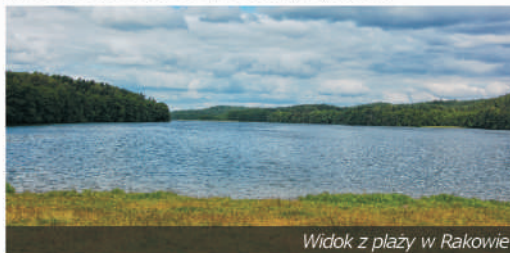
Widok z plaży w Rakowie

Nad jeziorem, z dwóch przeciwległych stron znajdują się plaże : jedna od strony Sikor, druga w pobliżu Rakowa. Komorze nie jest dostępne dla żeglarzy (głównie z powodu braku możliwości zwodowania większych żaglówek), jest natomiast dobrze znane wśród kajakarzy - to właśnie na tym akwenie rozpoczyna się spływ Piławą . Na końcu jednego z półwyspów, głęboko wcinających się w jezioro, zachowało się bardzo dobrze widoczne grodzisko stożkowe. Jezioro ma wody II klasy czystości.