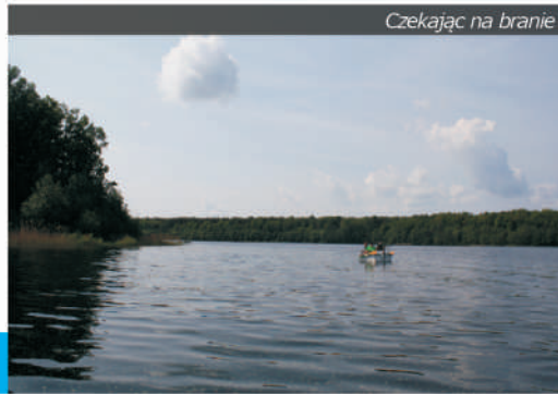
Czekając na branie

Woda jest bardzo przejrzysta, dno piaszczyste. Kaleńskie ma wody I klasy czystości i należy do zbiorników lobeliowych, czyli bardzo czystych jezior, w którym występują niezmiernie rzadkie gatunki roślin, na czele z niedużą, biało kwitnącą lobelią Dortmanna . Dzięki lokalizacji Ośrodka Sportu i Rekreacji, jezioro jest wykorzystywane turystycznie – znajduje się tu m. in. baza płetwonurków, rozgrywane są też mistrzostwa Polski w łowiectwie podwodnym . Niewielka głębokość i łagodne ukształtowanie dna sprzyjają także osobom, które dopiero poznają tajniki podwodnego pływania. Na jeziorze można uczyć się także żeglowania na desce lub małej żagłówce.