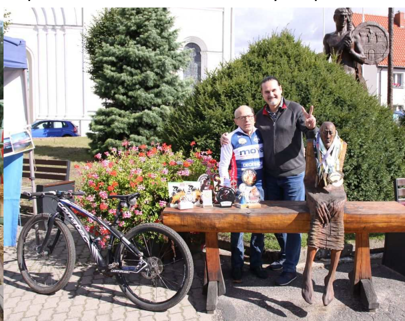
Festyn z okazji Dnia Bez Samochodu