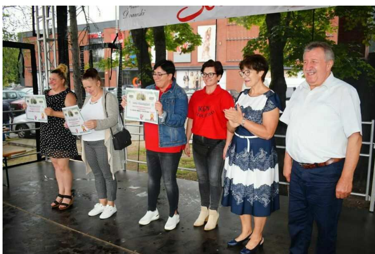
KGW Kluczewo z nagrodą