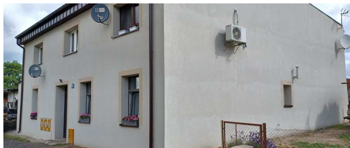
WM Grunwaldzka 5a nowa elewacja z dociepleniem ścian