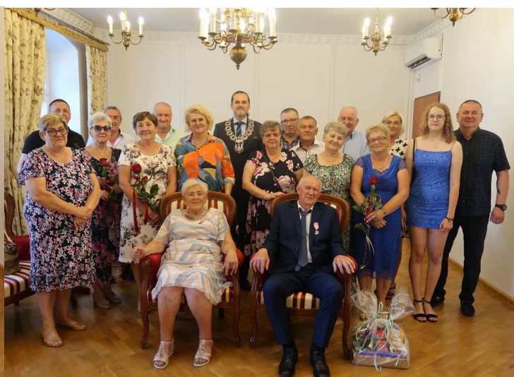
Jubileusz Państwa Ferenców