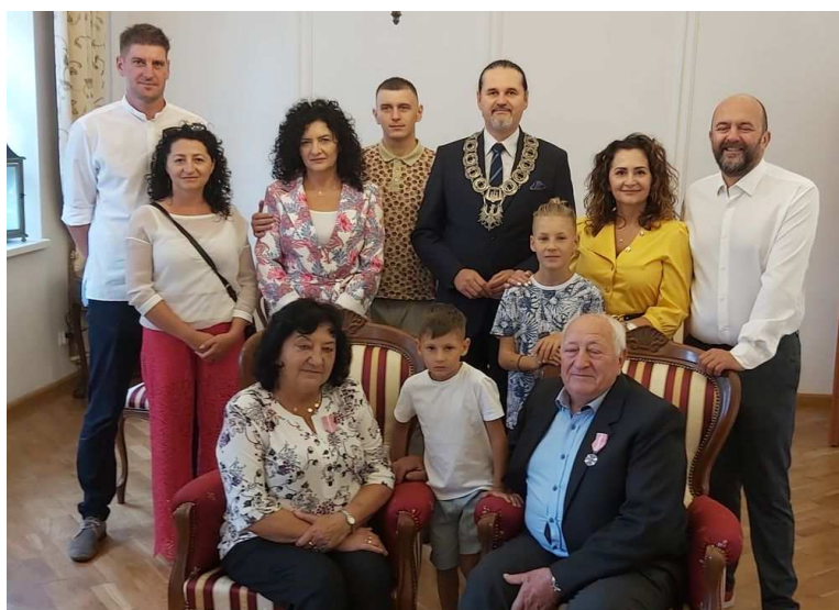
Jubileusz Państwa Wachów