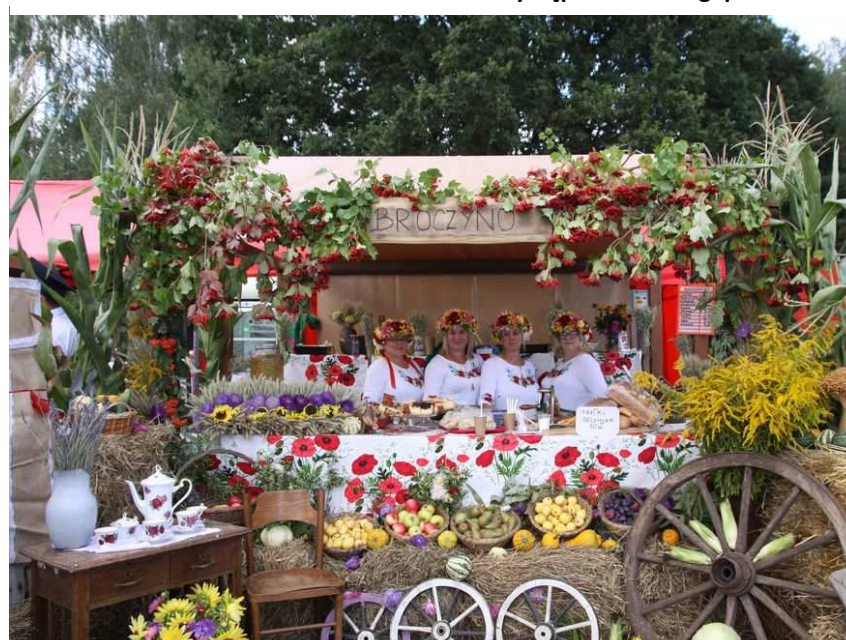
Gminne Święto Plonów w Machlinach