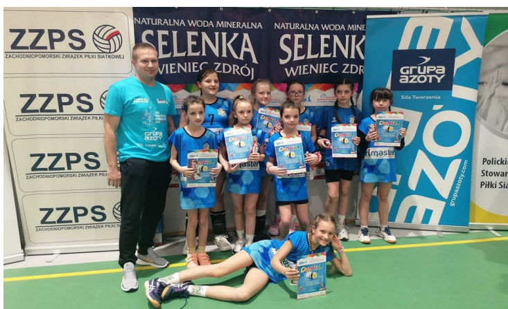
KPS Czaplonek na turnieju w Policach