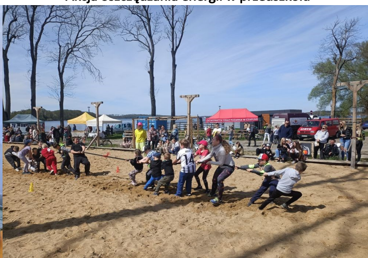
Piknik Rodzinny w Czaplunku