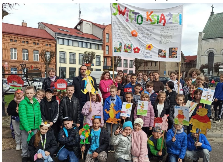
Święto Książki w szkole podstawowej