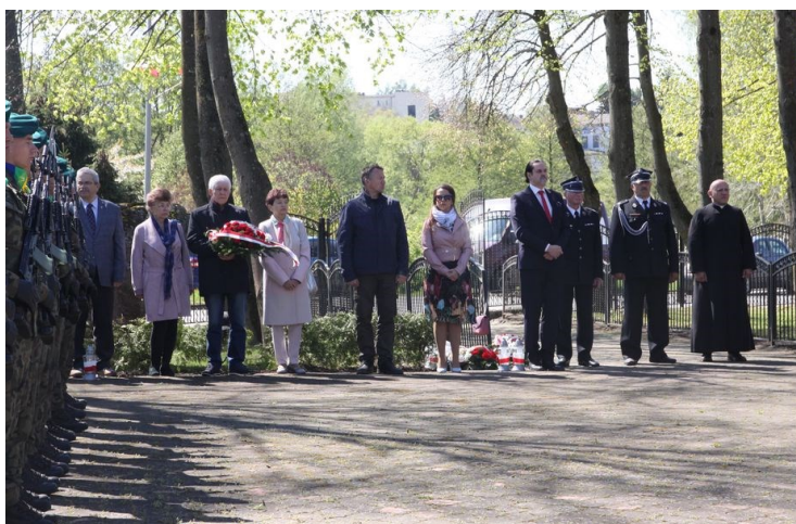
Obchody Narodowego Dnia Zwycięstwa