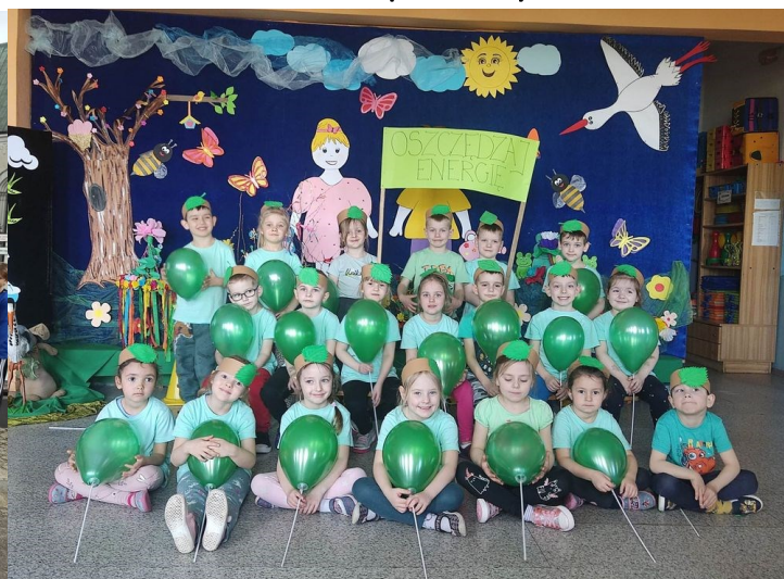
Akcja oszczędzania energii w przedszkolu