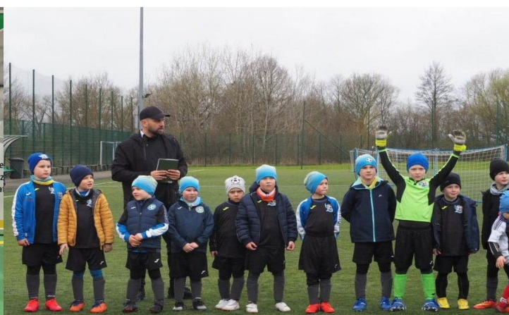
Turniej żaków młodszych AP Czaplonek