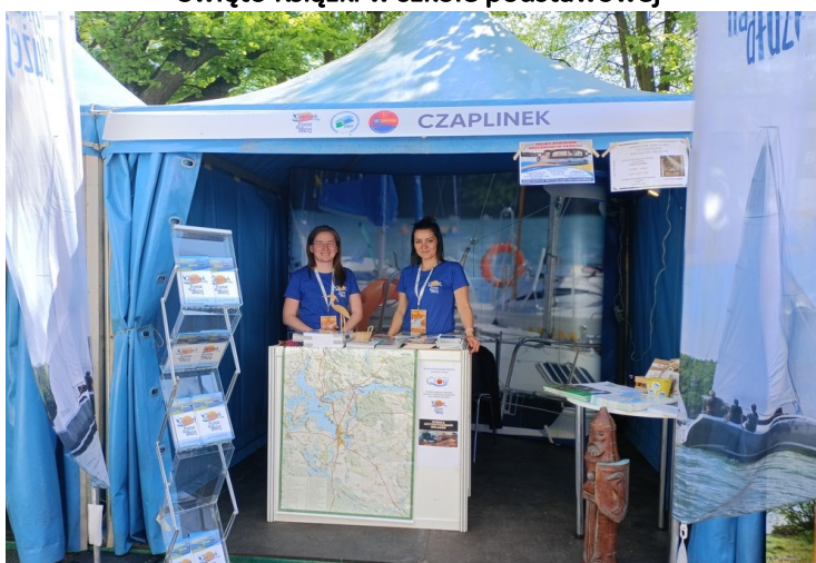
Gmina Czaplonek na targach w Szczecinie