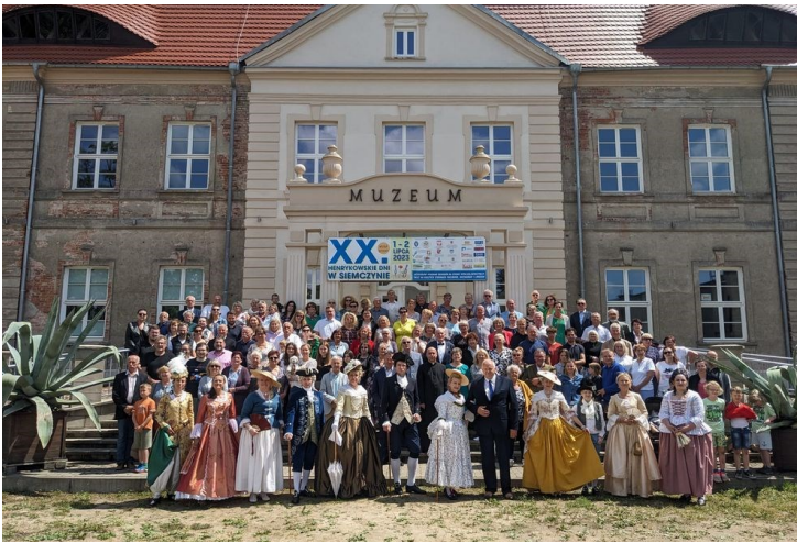
XX. Henrykowskie Dni w Siemczyńie