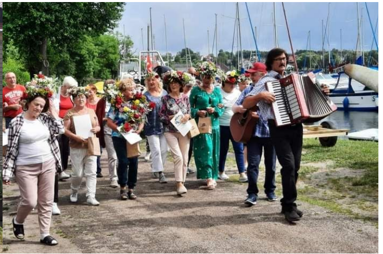
Wieczór świętojański w Klubie Seniora „Krystynka”