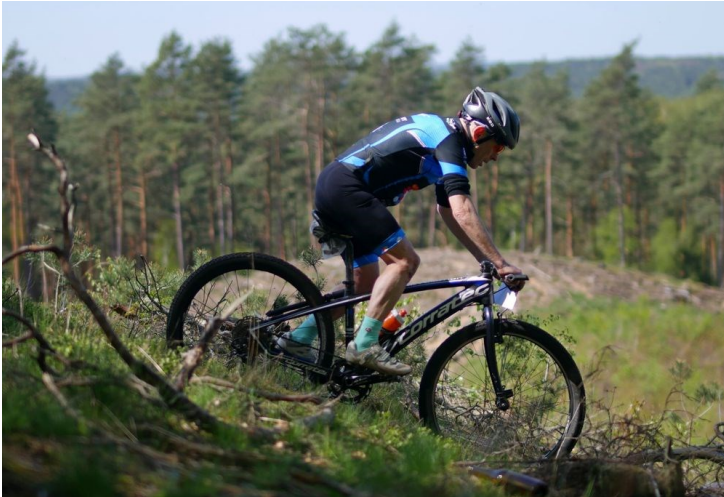
XVII. Maraton MTB - Gravel Dookoła Jeziora Miedwie