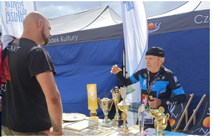
Najpiękniejszy Festiwal Świata ponownie w Czaplunku