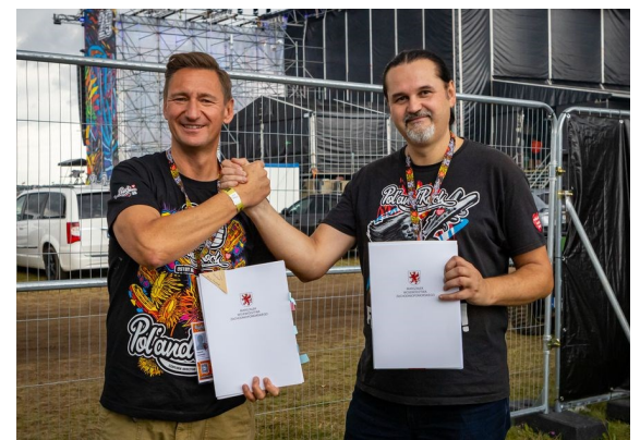
Marszałek Województwa Zachodniopomorskiego z Burmistrzem Czaplinka