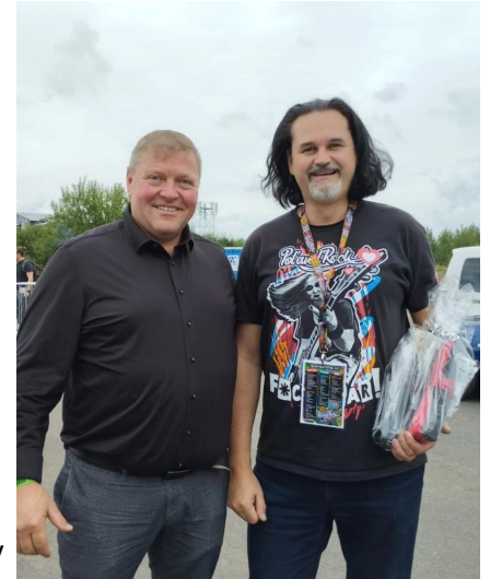
Burmistrz Czaplinka z Burmistrzem Grimmen na Pol'and'Rock Festival