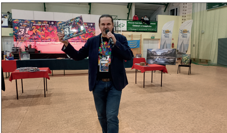
29 stycznia 2023 31. Finał Wielkiej Orkiestry Świątecznej Pomocy