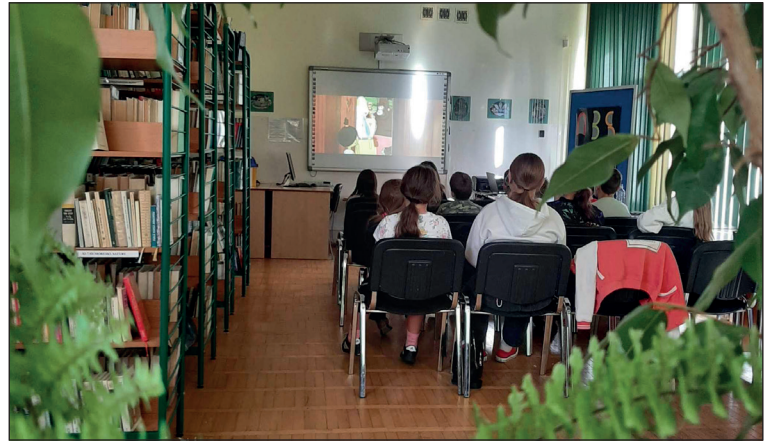
5 października 2023 Noc Bibliotek