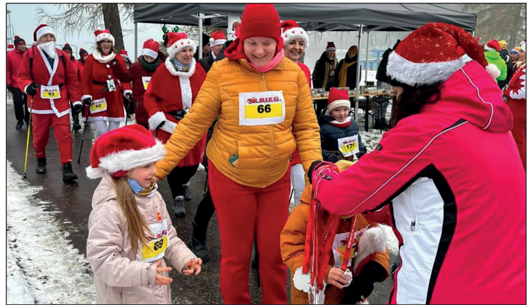
6 grudnia 2023 Czaplinecki Bieg Mikołajkowy