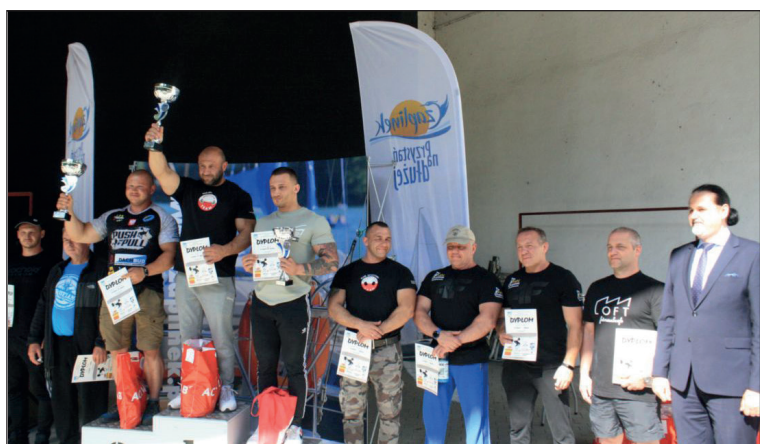
17 czerwca 2023 III Otwarte Mistrzostwa w Wyciskaniu Sztangi Leżąc