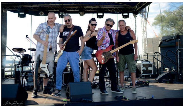
14-16 lipca 2023 Dni Czaplinka, koncert zespołu Ex Maanam