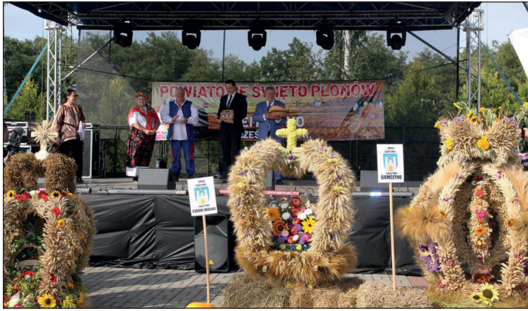
9 września 2023 Powiatowe Święto Płonów