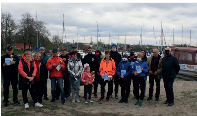
1 maja 2023 Regaty o Puchar Burmistrza Czaplinka – rozpoczęcie sezonu letniego