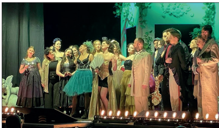
25 lutego 2023 Operetka Zemsta Nietoperza J. Straussa.