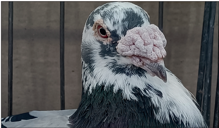
4-5 listopada 2023 XXVII Regionalna Wystawa Gołębi Rasowych, Drobiu Ozdobnego, Królików, Czaplinek 2023