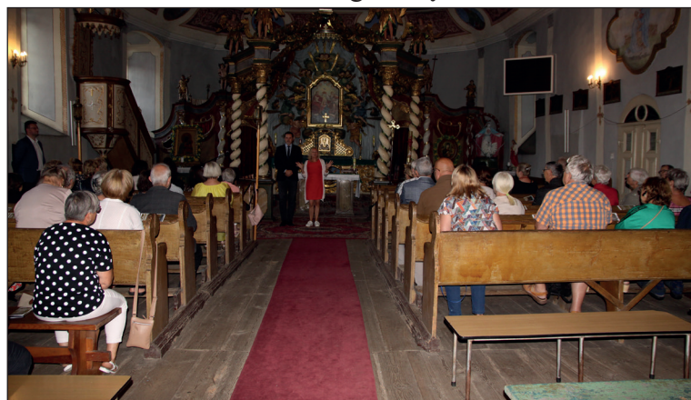
22-27 sierpnia 2023 Czaplincecki Tydzień Organowy