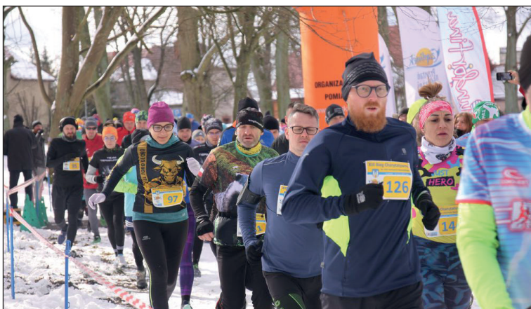
12 marca 2023 XIII Bieg Charytatywny im. chor. Kazimierza Masiowskiego