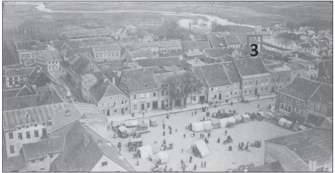
Ryc. 3. 3 - Siedziba Apteki pod Lwem (Löwen-Apotheke).

Wdowa Bötcher ponownie wyszła za mąż za niejakiego Rechenberga, który przejął