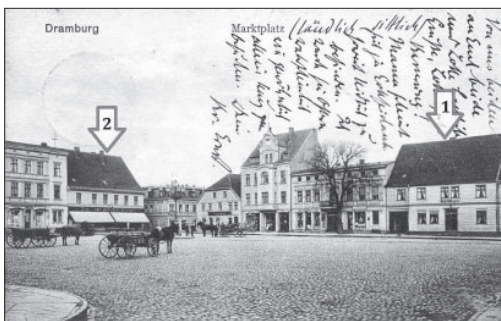
Ryc. 2. 1 - Siedziba najstarszej drawskiej apteki (zał. w 1652 r.) oraz późniejszej hoteli Maass, Geske i "Deutsches Haus". 2 - Siedziba drugiej drawskiej apteki (zał. w 1765 r.)

Europejskie tradycje aptekarskie bezpośrednio czerpały z wiedzy zgromadzonej przez Arabów, Greków i Rzymian. Szczególne znaczenie dla rozwoju tej dziedziny miały klasztory, które gromadziły i kopiowały księgi z zakresu medycyny i ziołolecznictwa. Zgromadzona wiedza posłużyła do organizacji ogrodów zielarskich (hortus medicus), a także klasztornych aptek (officinas sanitatis). Przyklasztorne ogrody i apteki służyły nie tylko chorym w szpitalach, ale całej lokalnej, świeckiej społeczności.