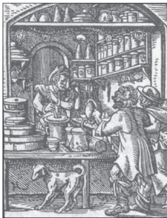
Ryc. 1. Apteka w XVI wieku

zwolenia wydawane przez władzę centralną. O koncepcji mogła ubiegać się osoba, która uzyskała odpowiednie kwalifikacje – tzw. patent aprobacyjny. Zasadniczo koncesja aptekarska wygasła po śmierci aptekarza, w związku z czym rodzina stawała się jedynie właścicielem nieruchomości i wyposażenia apteki, bez możliwości prowadzenia legalnie interesu. Traciła tym samym wszelkie środki utrzymania.