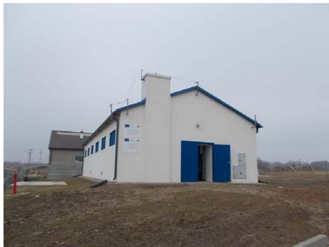
Marek Młynarczyk Kierownik Referatu Inwestycji i Budownictwa

Koszt całej inwestycji – 1.009.716 zł. Uzyskano dofinansowanie zewnętrzne w kwocie 549.032 zł. Środki własne wyniosły – 460.684 zł.