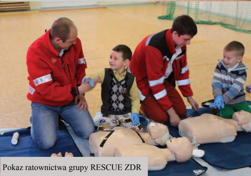
Pokaz ratownictwa grupy RESCUE ZDR