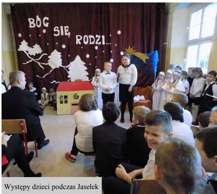
Występy dzieci podczas Jasełek