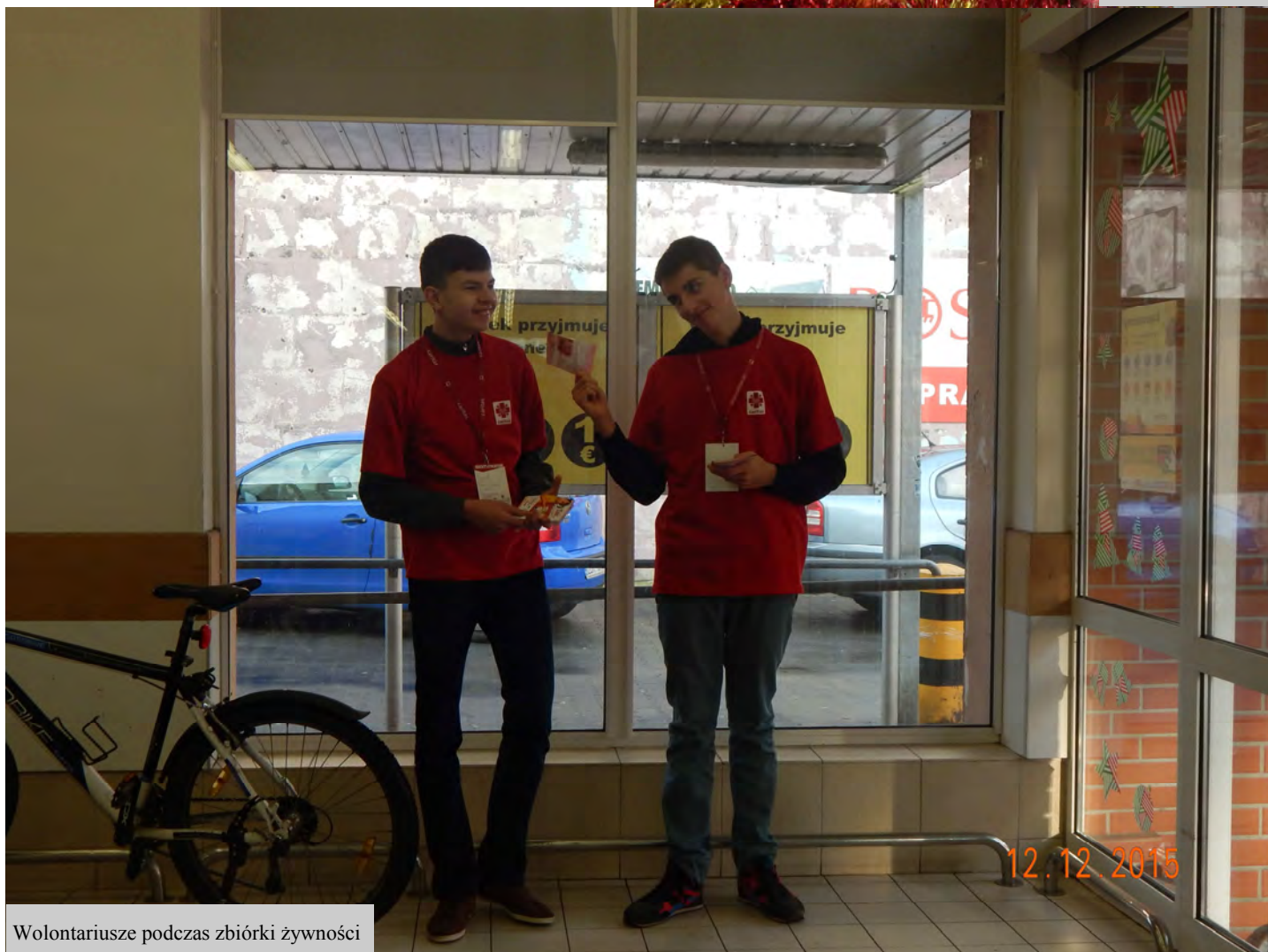
Wolontariusze podczas zbiórki żywności