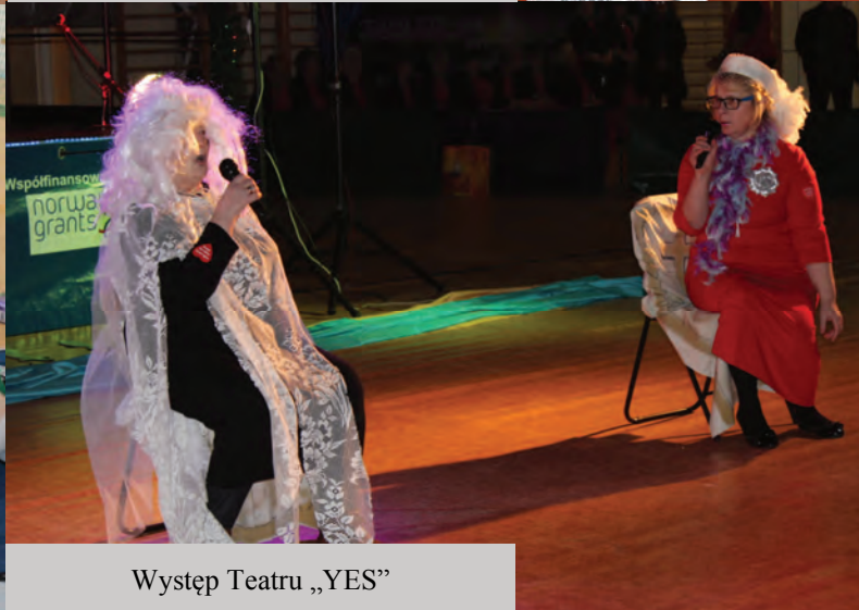
Występ Teatru „YES”