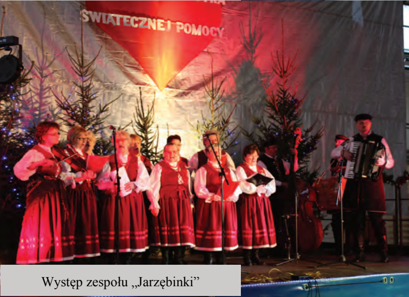
Występ zespołu „Jarzębinki”