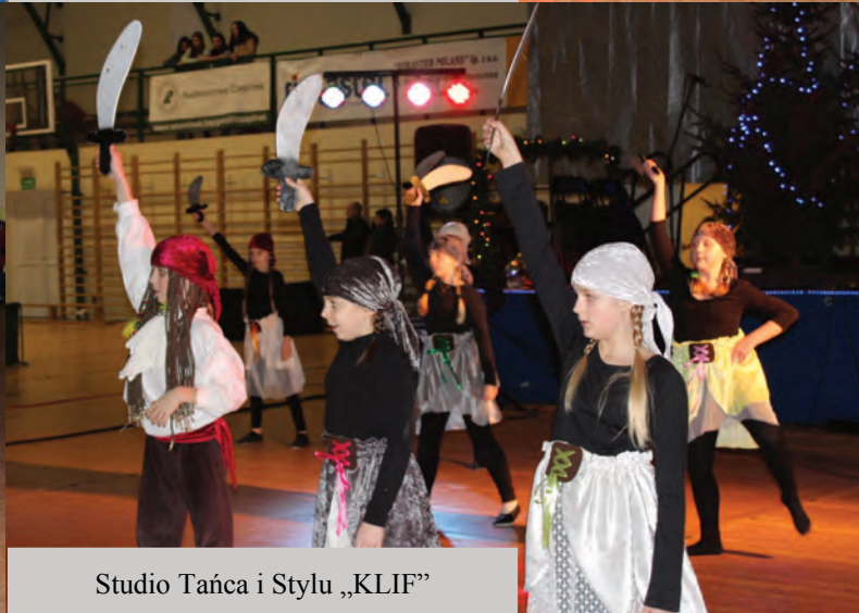
Studio Tańca i Stylu „KLIF”