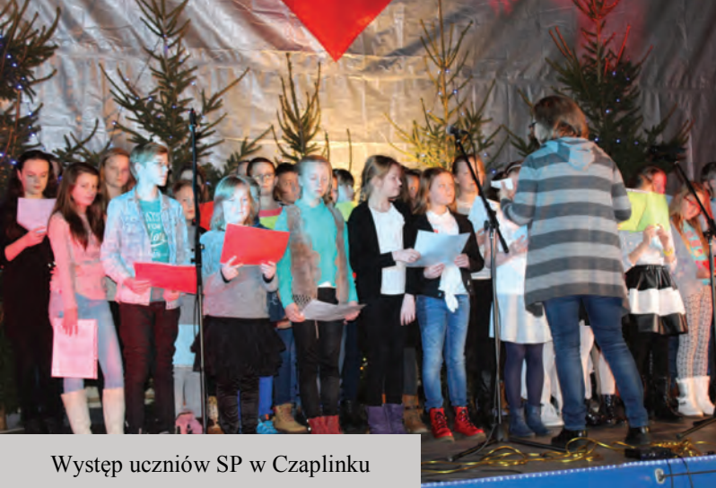
Występ uczniów SP w Czaplinku