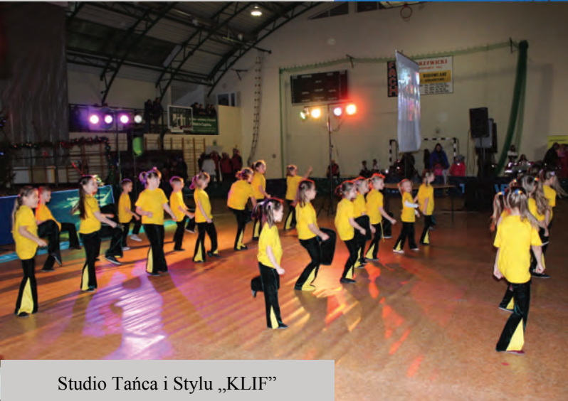
Studio Tańca i Stylu „KLIF”