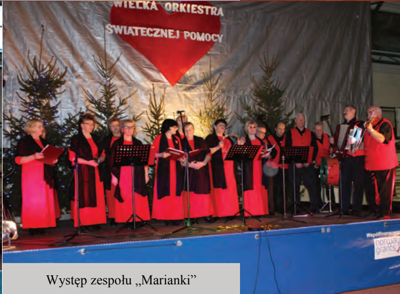
Występ zespołu „Marianki”