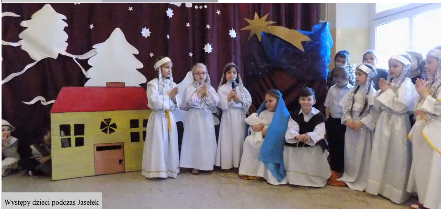
Występy dzieci podczas Jasełek