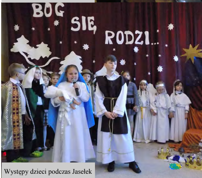
Występy dzieci podczas Jasełek