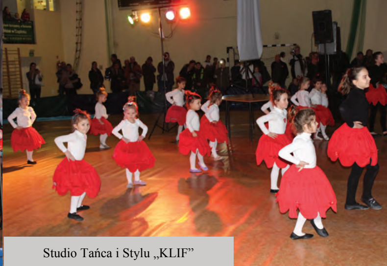
Studio Tańca i Stylu „KLIF”