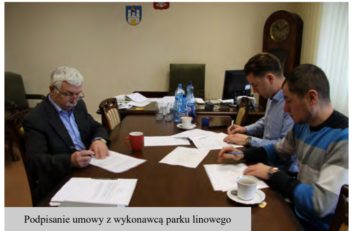
Podpisanie umowy z wykonawcą parku linowego