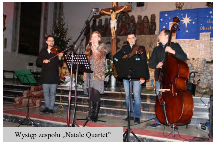
Występ zespołu „Natale Quartet”