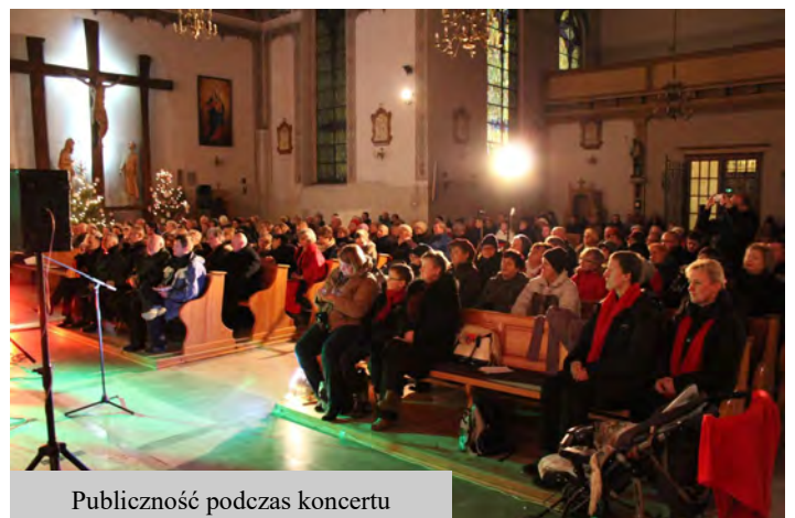
Publiczność podczas koncertu