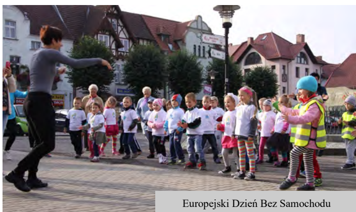
Europejski Dzień Bez Samochodu

22 września - Europejski Dzień bez Samochodu , to europejska akcja obywatelska promująca proekologiczne zachowania i korzystanie z publicznych środków transportu. Pierwszy „Dzień bez Samochodu” odbył się w 1998 roku we Francji. Akcja jest odpowiedzią na negatywne konsekwencje wynikające z nadmiernego ruchu samochodowego w miastach. Kampania zorganizowana jest na czterech szczeblach: europejskim, krajowym, regionalnym i lokalnym. W Czaplinku Europejski Dzień bez Samochodu obchodzimy od 2008 roku. Przy współpracy ze szkołami, przedszkolami organizujemy różnego rodzaju akcje, happeningi, konkursy.