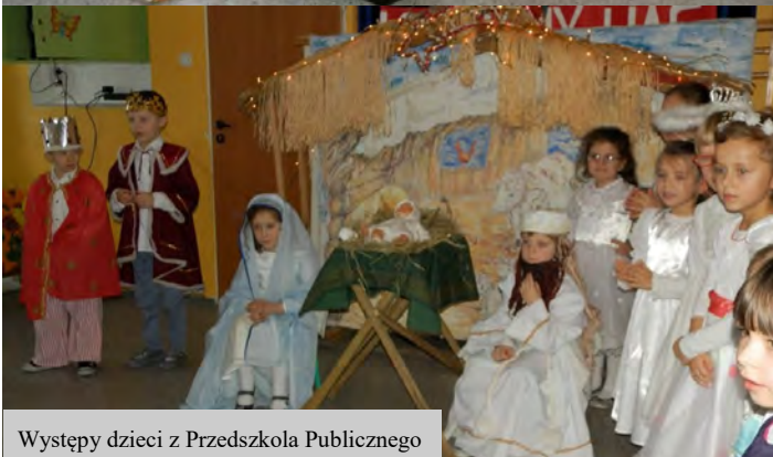
Występy dzieci z Przedszkola Publicznego