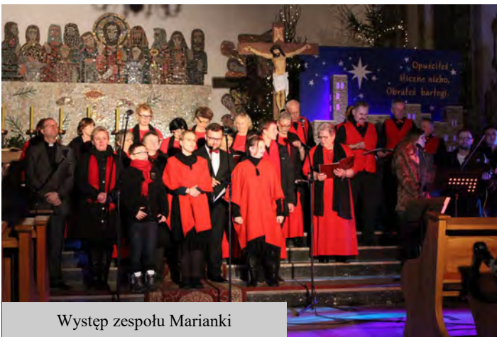
Występ zespołu Marianki