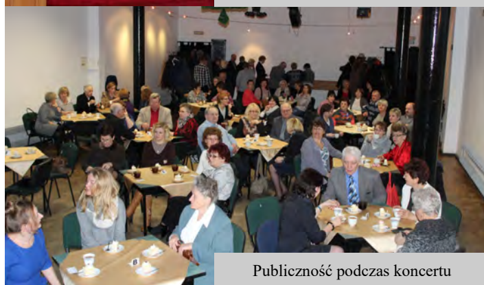
Publiczność podczas koncertu