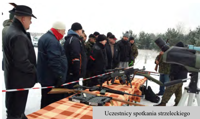
Uczestnicy spotkania strzeleckiego