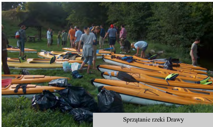
Sprzątanie rzeki Drawy

Co roku w pierwszy weekend września, już od czterdziestu lat na terenie Gminy Czaplinek przeprowadzana jest akcja SPRZĄTANIE RZEKI DRAWY , której głównym organizatorem jest Biuro Turystyczne „Mrówka”, a partnerem wspierającym Gmina Czaplinek. W tym celu Gmina Czaplinek, skutecznie aplikowała o środki finansowe do Wojewódzkiego Funduszu Ochrony Środowiska i Gospodarki Wodnej w Szczecinie, z projektem „Jesienne porządkowanie rzeki Drawy – najlepszym narzędziem promocyjno-edukacyjnym”. W tym roku akcja sprzątania Drawy zaplanowana jest na 3-4 września. Zapisy na spływ połączony ze zbieraniem śmieci prowadzi Biuro „Mrówka”, do którego należy zgłaszać imienne listy uczestników (imię, nazwisko, PESEL) na adres: czysta-drawa@mrowka.pl lub osobiście w biurze przy ulicy Wałęckiej 3 w Czaplinku. Każdy uczestnik indywidualnie zabezpiecza dla siebie namiot i inny sprzęt turystyczny. Osoby niepełnoletnie uczestniczyć mogą tylko pod opieką rodziców lub innej osoby dorosłej. Organizatorzy zapewniają ciepły posiłek, śniadanie, bezpłatnie kajak i miejsce noclegowe na polu namiotowym, koszulkę firmową i ubezpieczenie.