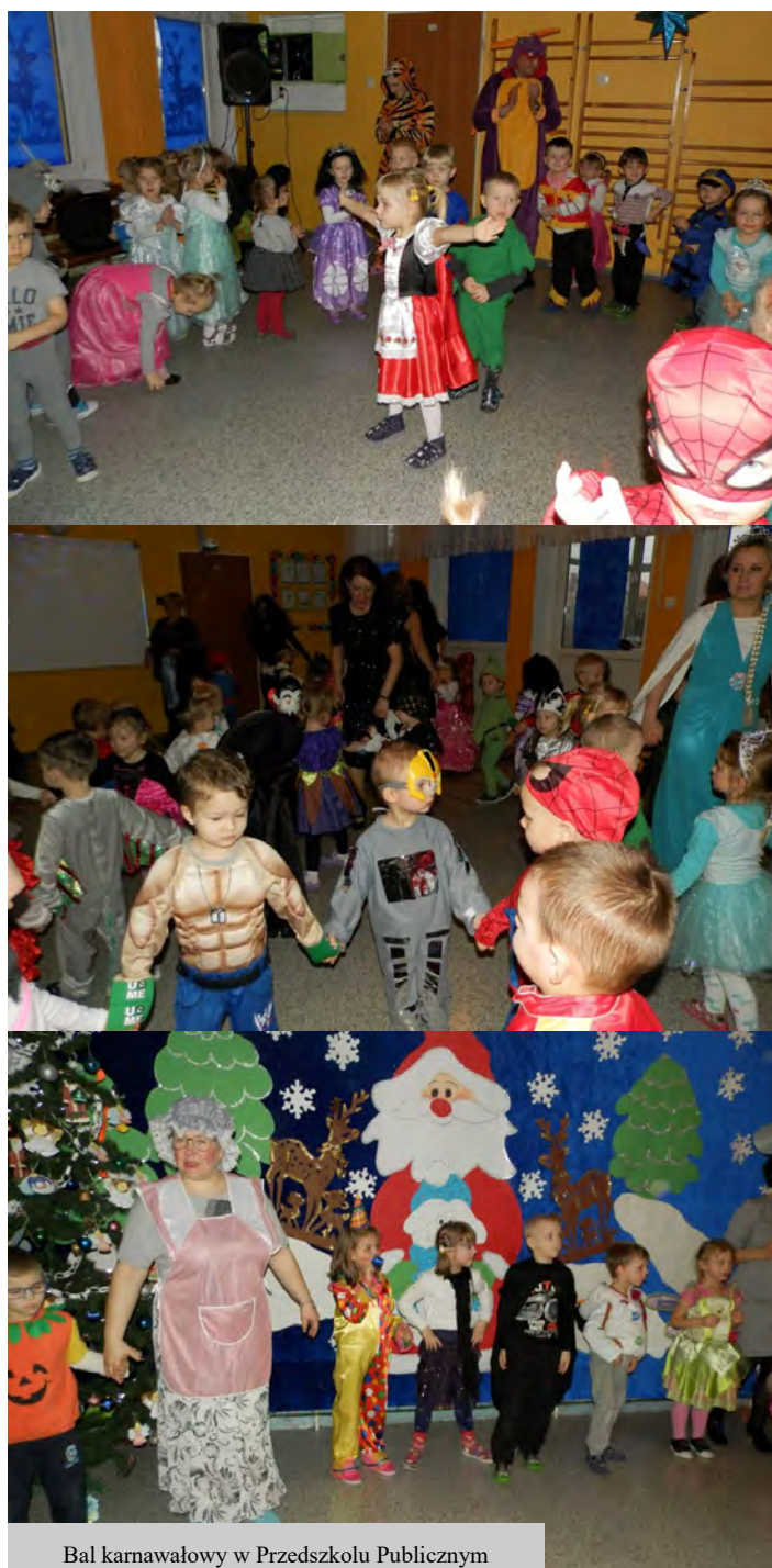
Bal karnawałowy w Przedszkolu Publicznym

Edyta Aleszko Przedszkole Publiczne w Czaplunku