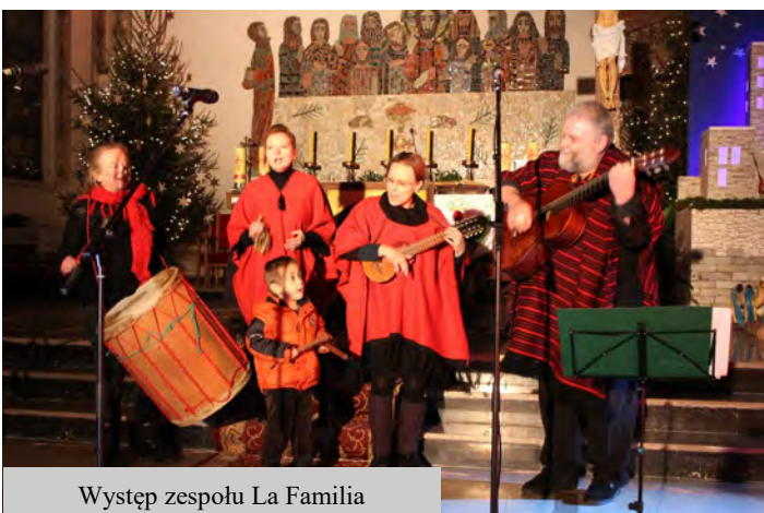
Występ zespołu La Familia