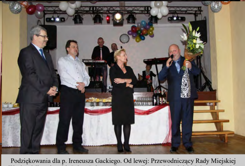
Podziękowania dla osób przygotowujących kolację