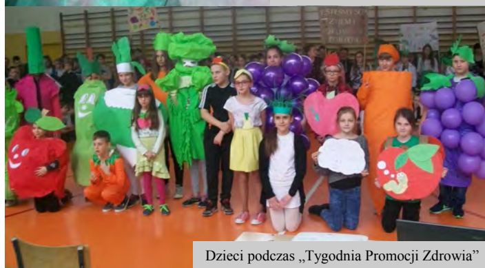
Dzieci podczas „Tygodnia Promocji Zdrowia”