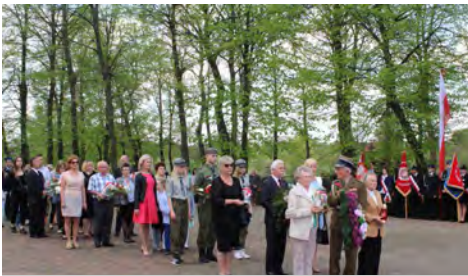
Poczty sztandarowe - Narodowy Dzień Zwycięstwa