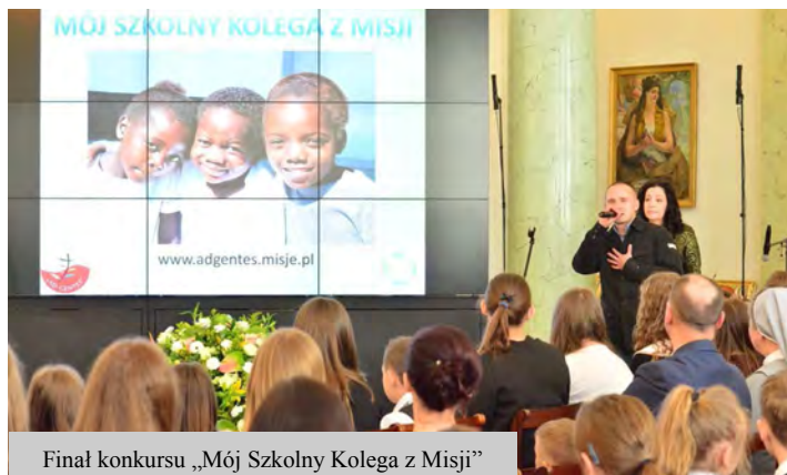
Finał konkursu „Mój Szkolny Kolega z Misji”