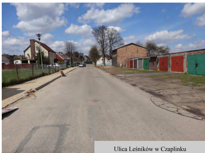
Ulica Leśników w Czaplunku