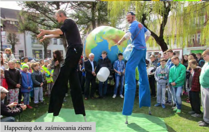
Happening dot. zaśmiecania ziemi