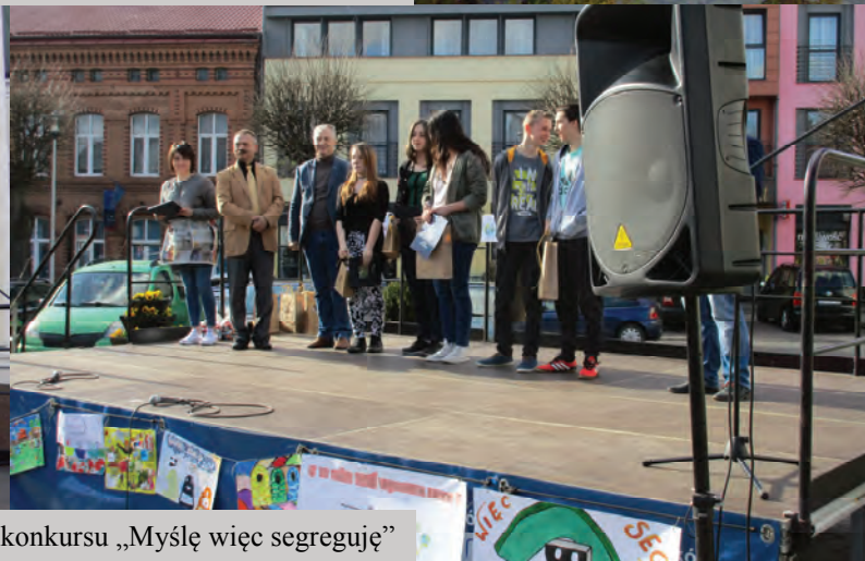
Wręczenie nagród dla laureatów konkursu „Myślę więc segreguję”