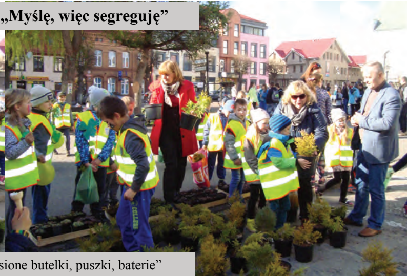
Akcja „Sadzonka za przyniesione butelki, puszki, baterie”