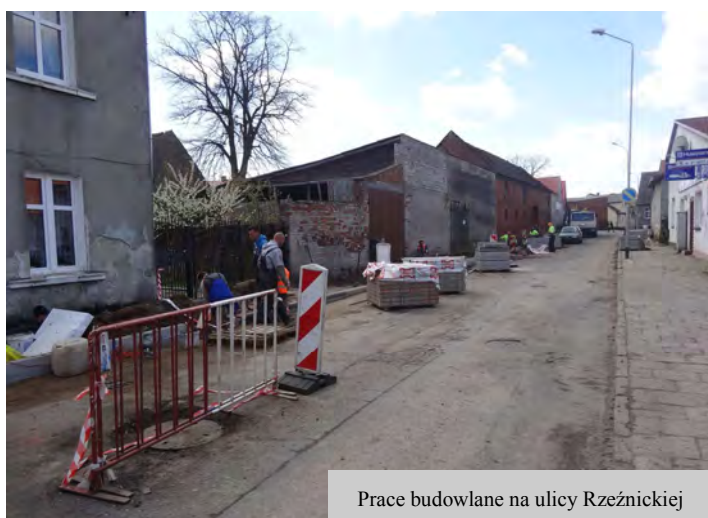
Prace budowlane na ulicy Rzeźnickiej

Przeprowadzone zostało postępowanie przetargowe w celu wyboru wykonawcy robót, w wyniku którego ofertę najkorzystniejszą złożyła firma POLDRÓG z Drawskiego Pomorskiego za kwotę 634 798,39 zł brutto z terminem realizacji do 30.09.2016 r. 7 marca 2016 r. przekazano dla Wykonawcy plac budowy. Rozpoczęcie robót przez Wykonawcę nastąpiło 4.04.2016 r. Trwają prace rozbiórkowe oraz drogowe związane z budową chodników, wjazdów oraz miejsc postojowych dla samochodów osobowych.