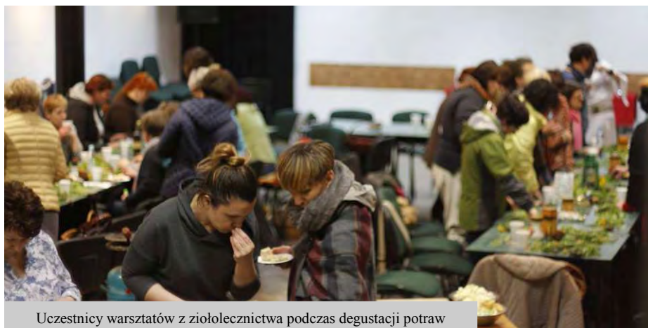
Uczestnicy warsztatów z ziołolecznictwa podczas degustacji potraw

Animator Kultury w Czaplineckim Ośrodku Kultury