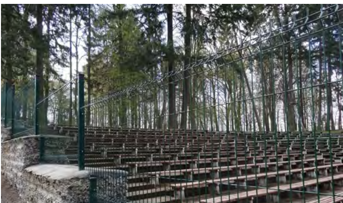
Nowe ogrodzenie amfiteatru (wartość zadania 29 126,60 zł)