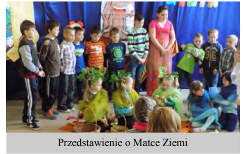
Przedstawienie o Matce Ziemi

Bogusława Fredyk Szkola Podstawowa w Czaplunku