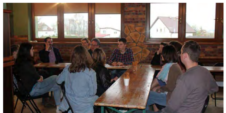
Uczestnicy warsztatów dziennikarskich.