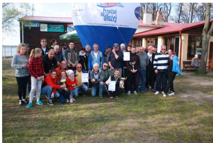
Uczestnicy regat żeglarskich