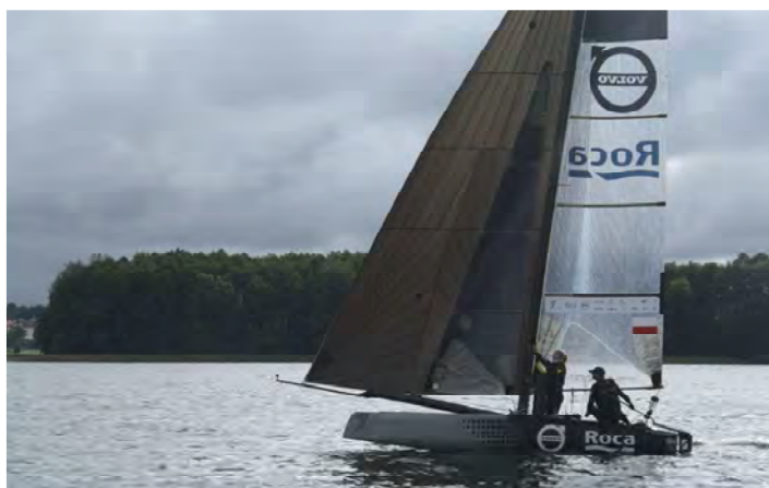
Mistrzowska załoga na katamaranie