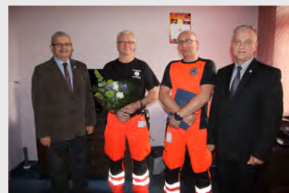
Podziękowania wręczone na ręce ratowników medycznych stacjonujących w Czaplinku