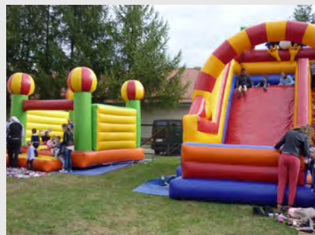
Atrakcje podczas Dnia Przedszkolaka