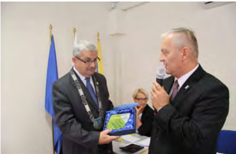
Wręczenie statuetki Nowy Lider Profilaktyki Grypy na ręce Przewodniczącego Rady Miejskiej w Czaplunku

W nawiązaniu do otrzymanego wyróżnienia oraz aktualnych działań Gminy Czaplunek dotyczących szczepień przeciw grypie dla osób w wieku 65 lat i więcej, Zastępca Burmistrza Czaplunku przedstawił prezentację multimedialną pn. „Profilaktyka zwalczania grypy w Gminie Czaplunek w latach 2010-2016”. Omówił przy tej okazji najważniejsze założenia i tematykę VIII Dorocznej Debaty Ekspertów Flu Forum 2016, w której miał zaszczyt uczestniczyć odbierając statuetkę dla gminy.