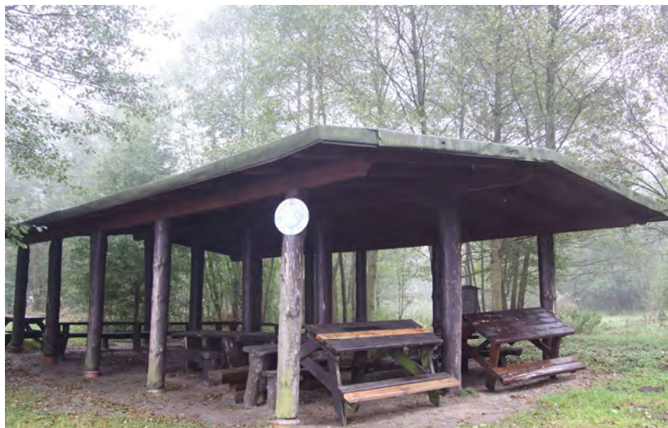
Zabezpieczone ławostoly przed niekorzystnymi warunkami atmosferycznymi