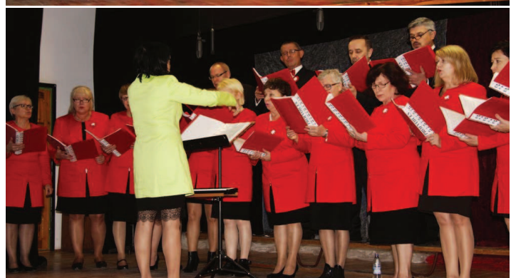
Koncert zespołu „Marianki” i Chóru Nauczycielskiego