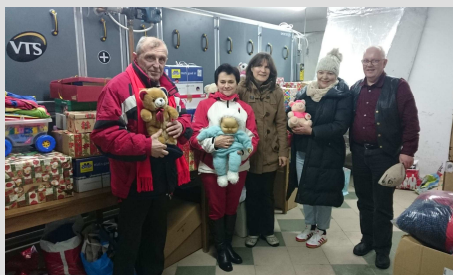
Przedstawiciele Kiwanis International Klub Czaplinek i delegacja z Grimmem podczas przekazania darów