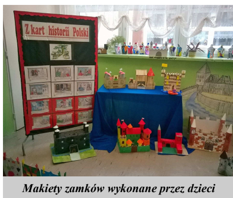
Makiety zamków wykonane przez dzieci

Jednym z zadań dla uczniów było przygotowanie makiet zamków. Prace uczniów przeszły nasze najsmielsze oczekiwania. Pojawiły się zamki wykonane z zapalek, z patyczków do lodów, z pudełek, butelek i innych dostępnych materiałów. Niektóre z prac charakteryzowały się dokładnymi szczegółami, m.in. były konie z wozami, rycerze, flagi, a nawet opał i siano dla zwierząt. Dużą ciekawostką okazał się zamek wykonany z ciasta. Po obejrzeniu przez dzieci został wspólnie zjedzony. Oprócz tego „mali historycy” wykonali rycerzy z papieru, a także stworzyli tarcze rycerskie według własnych pomysłów. Wszystkie prace dzieci zdobiją korytarz klas trzecich, gdzie każdy może je zobaczyć.