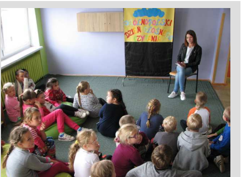
Pierwszoklasiści podczas Ogólnopolskiego Dnia Głośnego Czytania