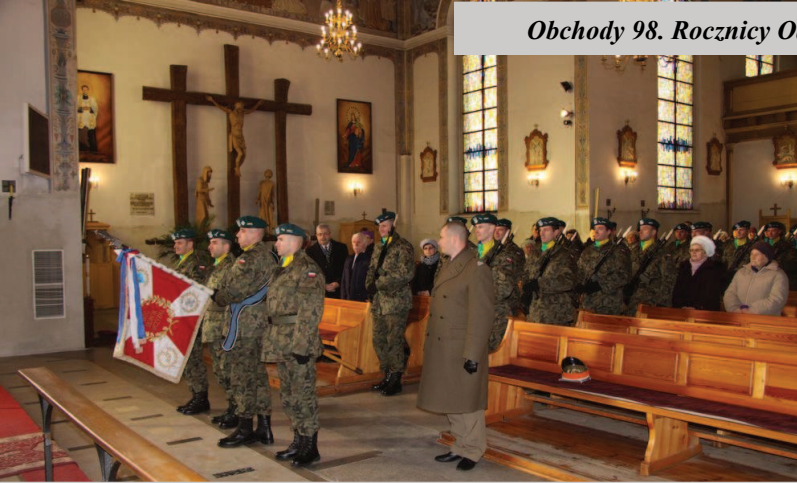
Poczty sztandarowe podczas Mszy Św. za ojczyznę