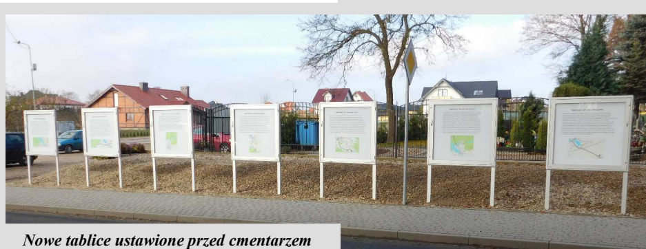
Nowe tablice ustawione przed cmentarzem

Ewelina Jakubczak pomoc administracyjno-biurowa Zakład Gospodarki Komunalnej