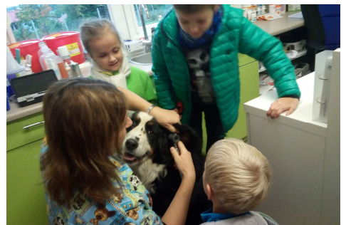
Wspólne badanie ucha psa