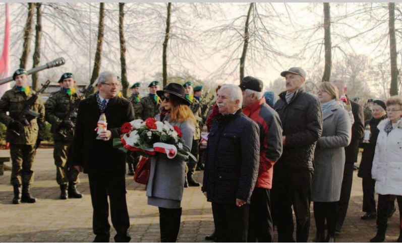
Złożenie kwiatów pod Pomnikiem Żołnierza przez delegację z Urzędu Miejskiego i Radnych Rady Miejskiej w Czaplunku