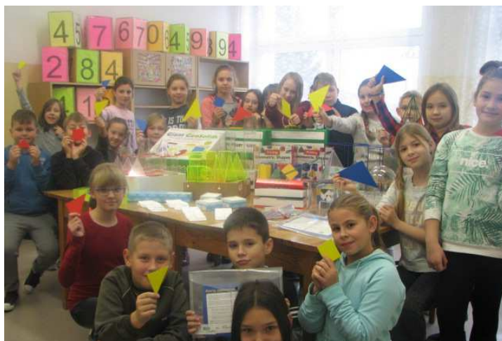
Uczestnicy projektu „Wprawiamy matematykę w ruch”

Zadaniem uczestników konkursu jest wykonanie zakładki do matematyki, która ułatwi naukę przedmiotu, wesprze przy rozwiązywaniu zadań w domu i szkole. Konkurs potrwa do 25 listopada 2016 r. Zwycięskie zakładki zostaną wydrukowane profesjonalnie w drukarni i przekazane wszystkim uczniom klas II etapu kształcenia.