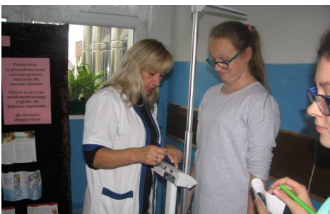
Uczniowie podczas badania BMI