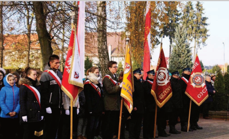
Poczty sztandarowe delegacji ze szkół i OSP