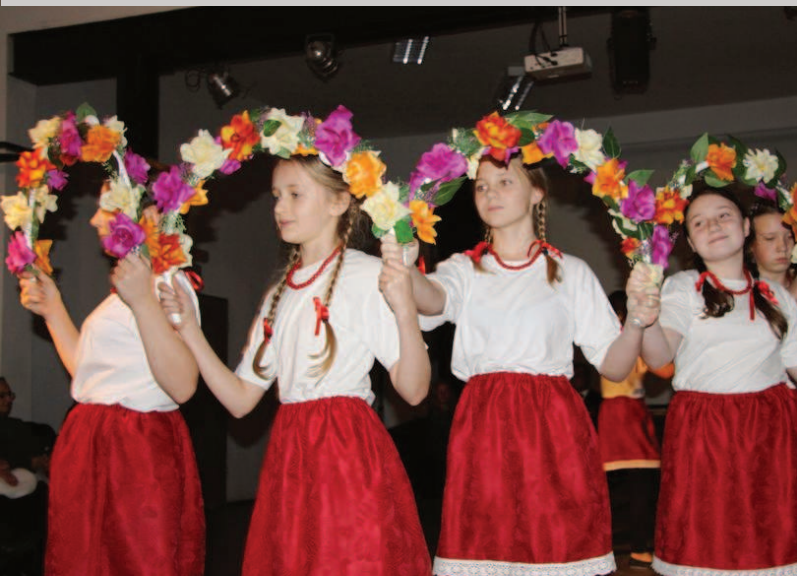
Występy artystyczne pt. „Listopadowa nostalgia” w CzOK-u