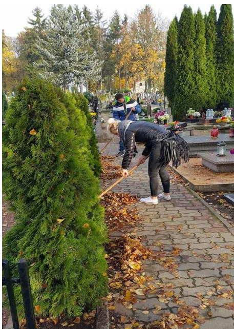
Prace porządkowe na cmentarzu

Zakład Gospodarki Komunalnej w Czaplinku bardzo dziękuje za zaangażowanie dziewcząt z Młodzieżowego Ośrodka Wychowawczego w coroczne prace porządkowe na Cmentarzu Komunalnym w Czaplinku.