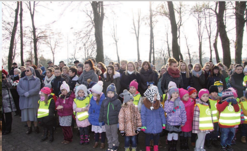
Najmłodszy uczestnicy obchodów na cmentarzu