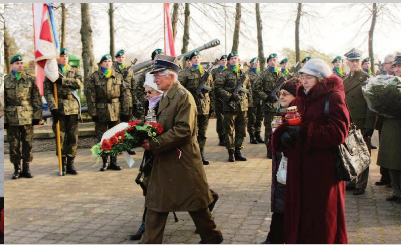
Kombatanci wraz z rodzinami składają hołd pod Pomnikiem Żołnierza