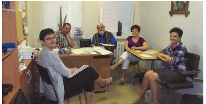
Koło Diabetyków w Czaplunku

Serdecznie zapraszamy osoby chore na cukrzycę, członków ich rodzin oraz wszystkie osoby, które sympatyzują z nami do wstąpienia w nasze szeregi.