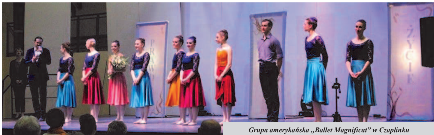
Grupa amerykańska „Ballet Magnificat” w Czaplunku