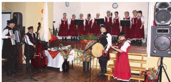
Występ Zespołu Ludowego „Jarzębina”