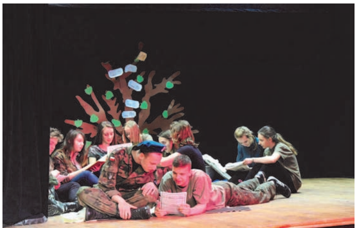
Spektakl pt. Co słyszało drzewo Sceny z pamiętnika żołnierza i sanitariuszki