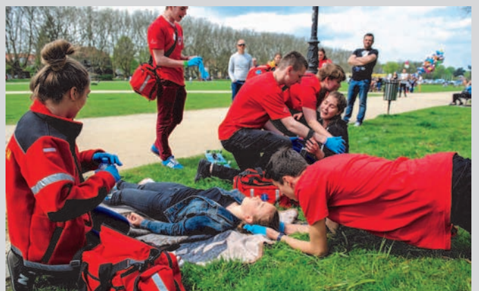
Grupa RESCUE TEAM ZSP Czaplinek