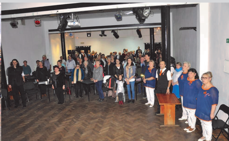
Wspólne śpiewanie pieśni patriotycznych