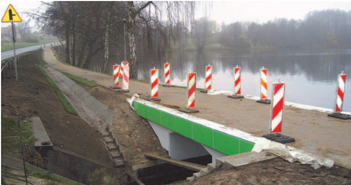
Roboty budowlane na ścieżce pieszko-rowerowej przy ul. Złocienieckiej

Zbliżają się do końca prace budowlane na drodze krajowej nr 20 realizowane przez zarządcę drogi związane z budową ścieżki pieszko-rowerowej przy ul. Złocienieckiej w Czaplonek oraz odnową nawierzchni bitumicznej w ulicy 7-go KPP wraz z przebudową chodnika. Koszt tych