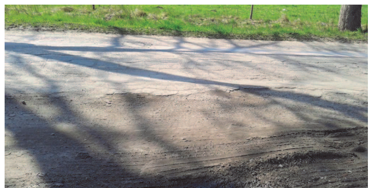
Droga przeznaczona do przebudowy

powiatowy przy współpracy samorządu gminnego złożył wniosek o dofinansowanie przebudowy drogi powiatowej na odcinku od skrzyżowania z przejazdem kolejowym Czarne Małe do miejscowości Łysin in o długości 2,7 km na kwotę 2,7 mln zł, z czego udział Gminy Czaplonek zaplanowany został na poziomie 0,5 mln zł. Ocena złożonych wniosków dokonywana przez zespoły powołane przez Wojewodę Zachodniopomorskiego pozwoliła na ustalenie wstępnej listy rankingowej, na której wśród 25 przewidzianych do dofinansowania zadań drogowych znajduje się zadanie z terenu naszej gminy. Harmonogram dokonania oceny i wyboru wniosków o dofinansowanie zakłada zakończenie całego procesu do 31.12.2017 r., którego efektem będzie zatwierdzenie i ogłoszenie przez wojewodę listy wniosków zakwalifikowanych do dofinansowania. Zadanie polegające na przebudowie drogi Czarne Małe – Łysin in zostało wysoko ocenione, plasując się na 11 pozycji, zatem zatwierdzenie ostatecznej