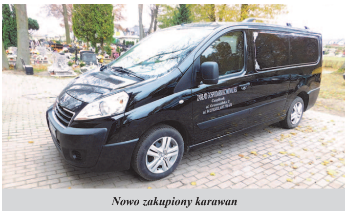
Nowo zakupiony karawan

27.10.2017 r. Zakład Gospodarki Komunalnej w Czaplunku z własnych środków zakupił dodatkowy karawan pogrzebowy. Od tej chwili oprócz Forda Mondeo posiadamy również Peugeot Expert, który będzie godnie reprezentował nasz zakład. Samochód wyposażony jest w komorę na dwie trumny, co na pewno usprawni pracę zakładu komunalnego w dziale pochówków.