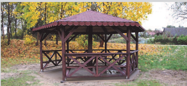
Broczyno - altana, która powstała w ramach funduszu sołeckiego