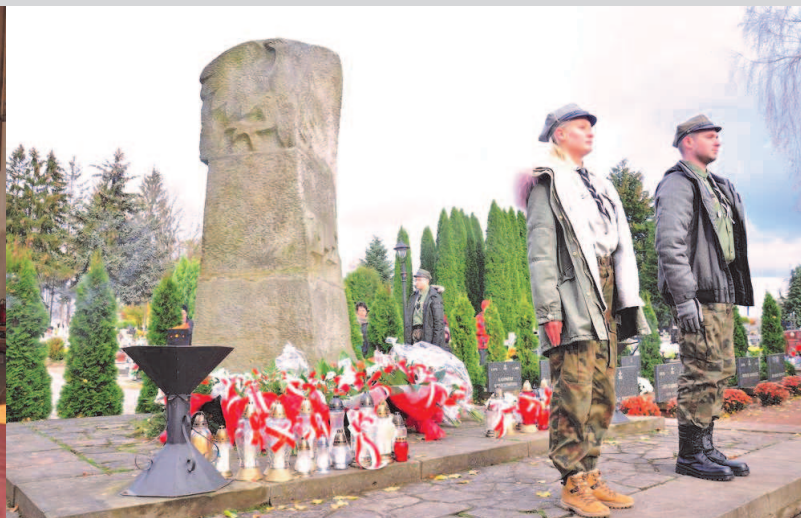
Warta pod Pomnikiem Żołnierza