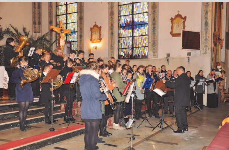
Młodzieżowa Orkiestra Dęta „Kujawia”