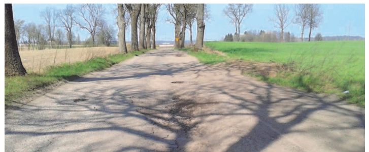
Droga przeznaczona do przebudowy

W wyniku ogłoszonego we wrześniu br. naboru wniosków o dofinansowanie zadań w ramach „Programu rozwoju gminnej i powiatowej infrastruktury drogowej na lata 2016-2019” na rok 2018 samorząd