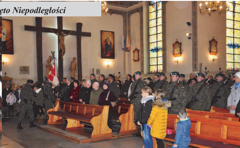
Msza Święta w kościele pw. Podwyższenia Krzyża Świętego