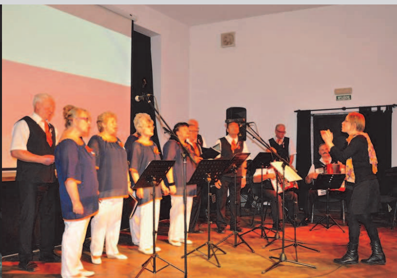
Koncert zespołu Marianki