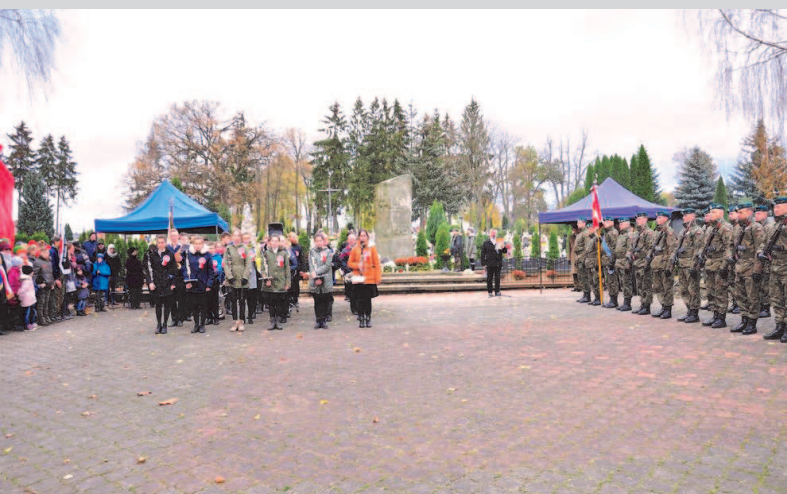
Złożenie kwiatów przez delegacje pod Pomnikiem Żołnierza