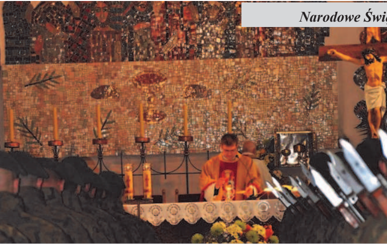
Msza Święta w kościele pw. Podwyższenia Krzyża Świętego