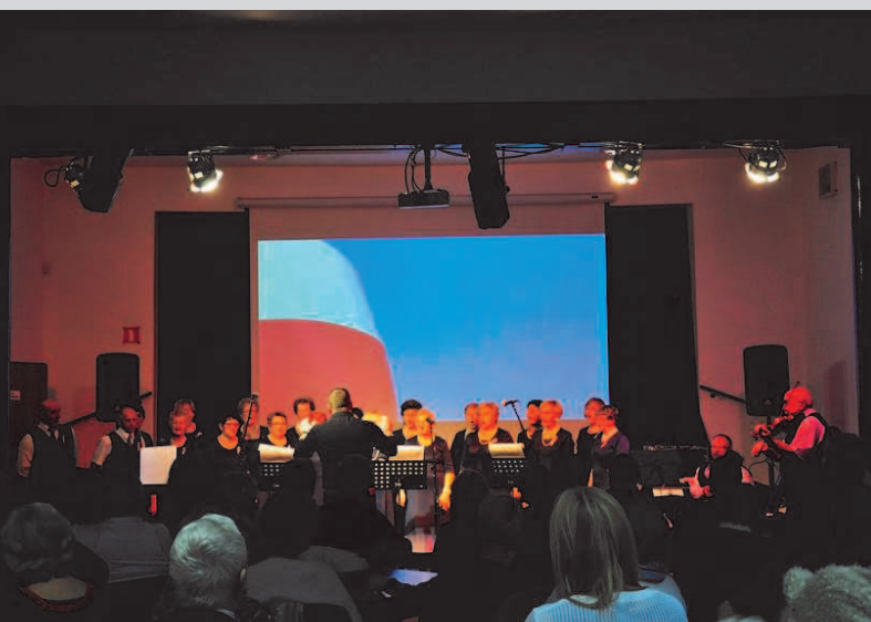
Koncert zespołu OdNowa