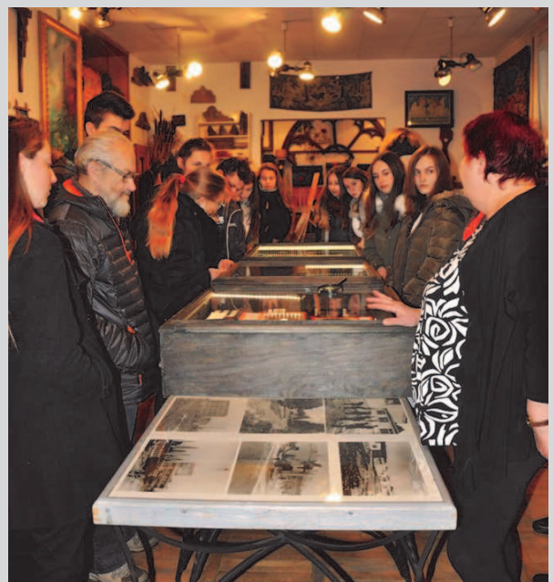
Mieszkańcy, którzy przybyli na oficjalne otwarcie wystawy