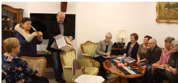
Członkowie Klubu Senior+ testują nowe urządzenie

Na ręce dyrekcji przedszkola przekazano odblaskowe kamizelki i opaski, natomiast szkoła podstawowa została wyposażona w materiały dydaktyczne dotyczące problematyki uzależnień oraz opaski odblaskowe.