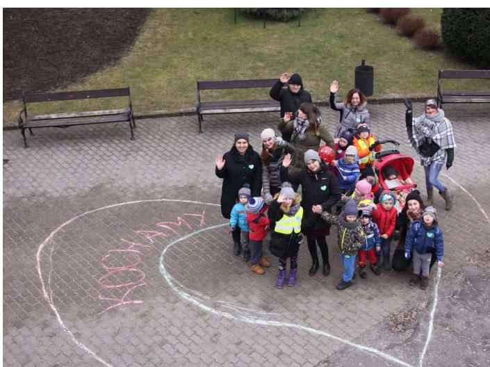
Wizyta dzieci z Zespołu Placówek Edukacyjno-Terapeutycznych w Bobrowie, oddział w Czaplinku

Jednocześnie informujemy, że jeżeli ktoś nie zdążył oddać swoich baterii podczas akcji, może jeszcze to zrobić, gdyż zbiórkę prowadzimy do Dnia Ziemi, czyli do 22 kwietnia br. Zużyte baterie i elektroodpady można zostawić w siedzibie Urzędu Miejskiego w Czaplinku, ul. Rynek 6.