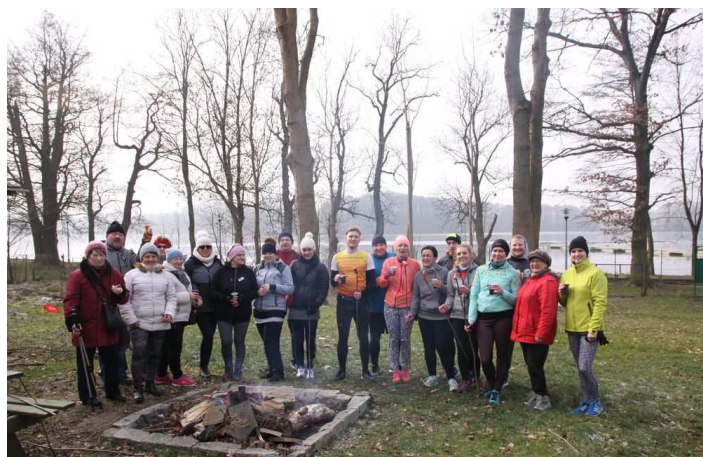
Uczestnicy akcji „Zdrowiej z kijkami”

Wesoła atmosfera, wymiana doświadczeń pomiędzy biegaczami i miłośnikami nordic walking, gorąca herbata i smaczne pieczone kielbaski, a przede wszystkim aktywnie spędzony czas