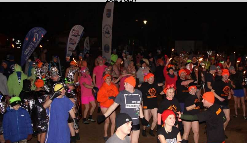
Rozgrzewka przed kąpielą