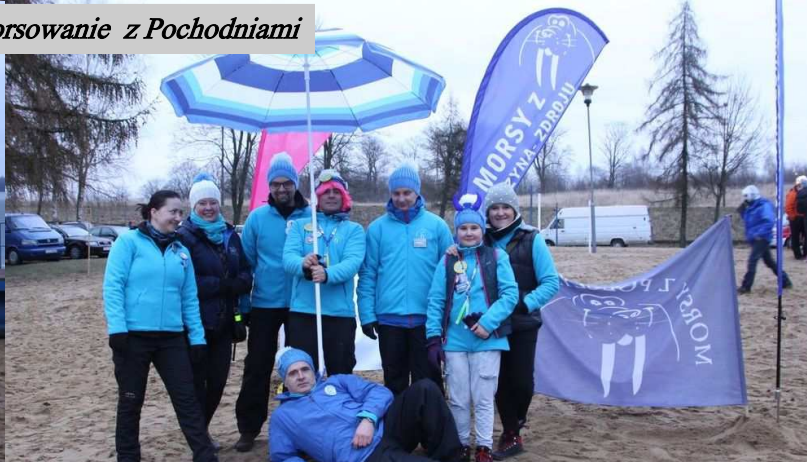
Morsy z Polczyna Zdroju