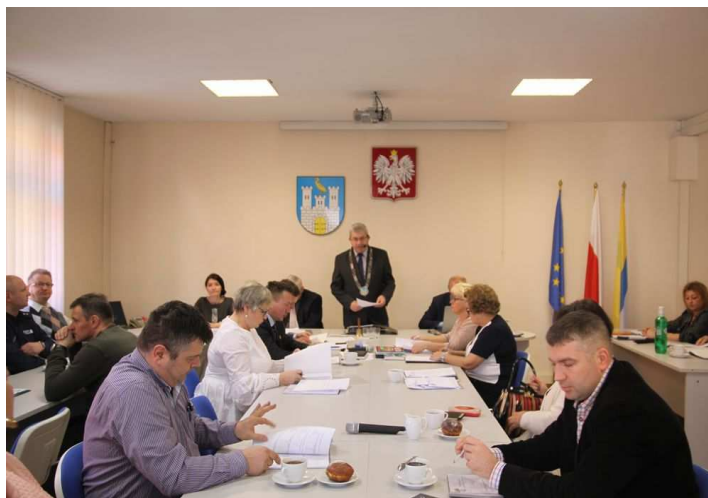
Obrady XL Sesji Rady Miejskiej w Czaplunku