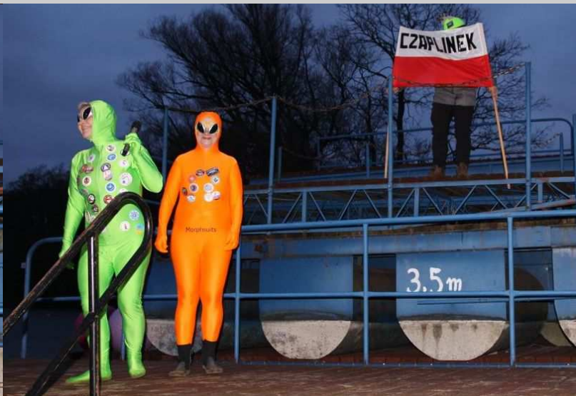
Przedstawicielki czaplinek „Morsów Bez Forsy”