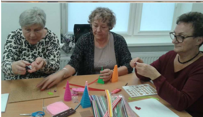
Uczestniczki warsztatów quillingu