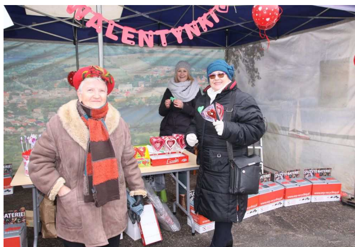
Mieszkańcy Czaplinka chętnie przyłączyli się do akcji