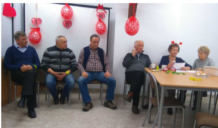
Uczestnicy „Randki w ciemno”