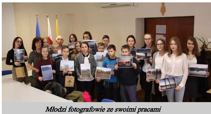
Młodzi fotografowie ze swoimi pracami

Jak się okazało mamy wielu młodych mieszkańców kochających Czaplinek, a przy tym chcących podzielić się swoim wspomnieniem poprzez udział w konkursie. Do konkursu napłynęło 18 prac. Fotografie ukazywały różne zakątki naszej gminy, te znane, jak również bardziej tajemnicze. Jury przy ocenie prac brało pod uwagę również uzasadnienie stanowiące niezbędny element konkursu, w którym wystarczyło opisać dlaczego właśnie to miejsce kojarzy się ze wspomnieniem, które warto zatrzymać w kadrze aparatu.