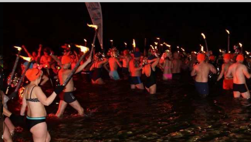
Bieg do wody