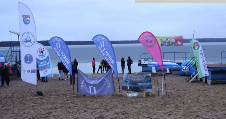
Plaża miejska gotowa na przyjęcie „morsów”