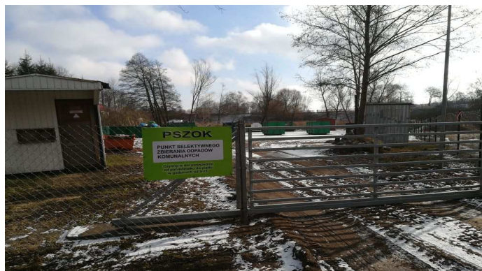
Punkt Selektywnej Zbiórki Odpadów Komunalnych

Wszelkie odpady dostarczane przez firmy, przedsiębiorstwa i osoby prowadzące działalność gospodarczą są przyjmowane odpłatnie.