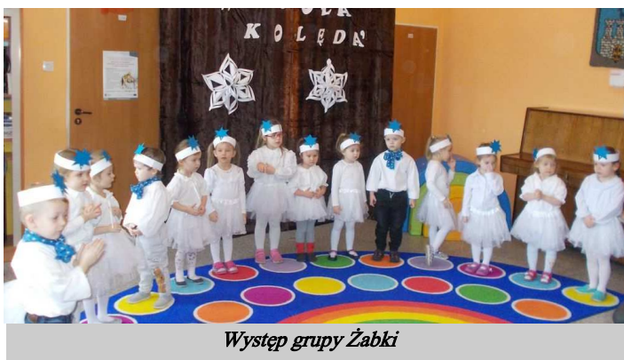
Występ grupy Żabki