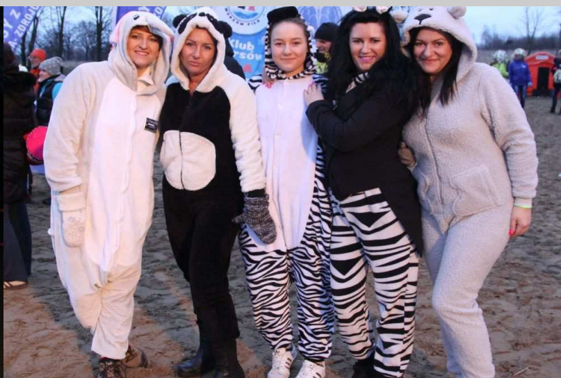
Klub „Starmors” z Miastka