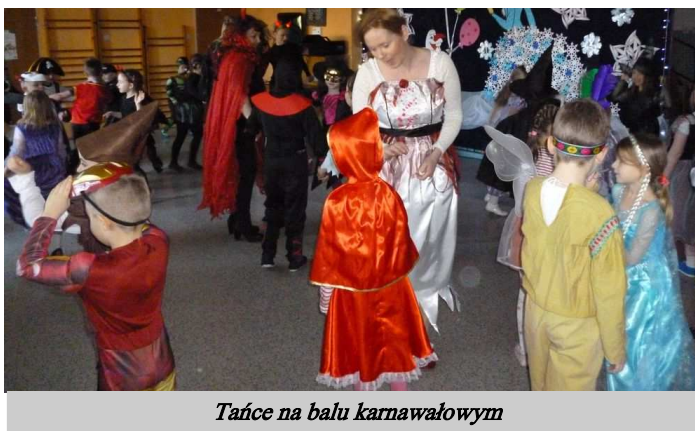
Tańce na balu karnawałowym

W te dni już od rana w przedszkolu pojawiały się kolorowe postacie. Dzieci przebrane były za bohaterów znanych bajek. W salach przedszkolnych można było spotkać wróżki, królewny, delikatne motylki, rycerzy, piratów, policjantów, karateków, Spider Mana, Batmana... nie sposób zliczyć i wymienić wszystkich. Było bardzo trudno rozpoznać dzieci. Z przedszkolakami bawili się także rodzice, którzy zachwycaли pomysłowością swoich balowych kreacji. Miłym gestem tatusiów było