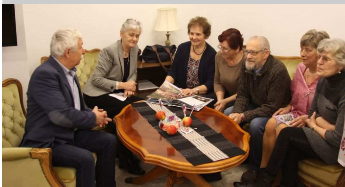
Walentynki w Klubie Senior+