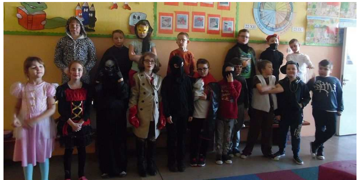
Bał karnawałowy w klasach I-III