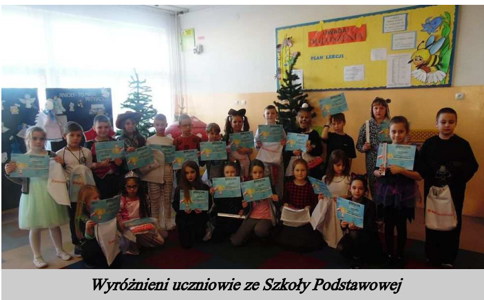
Wyróżnieni uczniowie ze Szkoły Podstawowej