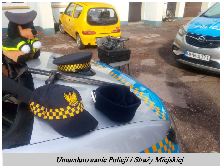
Umundurowanie Policji i Straży Miejskiej

Strażnicy zaprezentowali również maluchom nowo zakupiony przez Gminę Czaplinek dron, który może być wykorzystywany do powietrznego patrolu miasta i gminy.