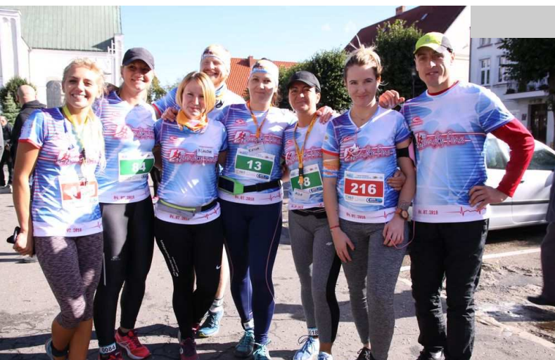
Czaplinecka Grupa Biegowa „Rundorfina”