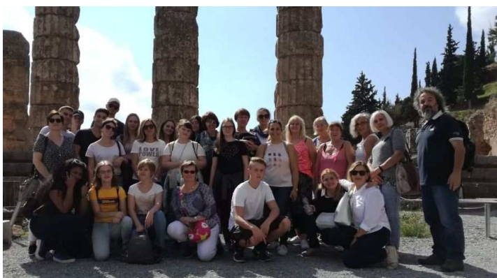
Przed świątynią Apolla w Delfach

Międzynarodowe wymiany w ramach projektu Erasmus+ to nie tylko zabawa, ale również praca. Nauczyciele przeprowadzili zajęcia artystyczne oraz matematyczne oparte na mitologii krajów partnerskich, a uczniowie stworzyli album fotograficzny dokumentujący ich wyprawy w miejsca związane z mitologią grecką.