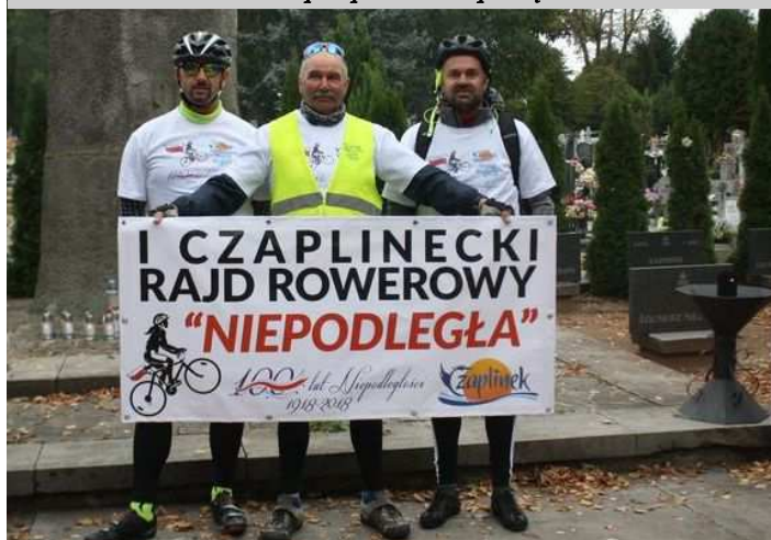
Na mecie – czaplinecki Cmentarz Komunalny