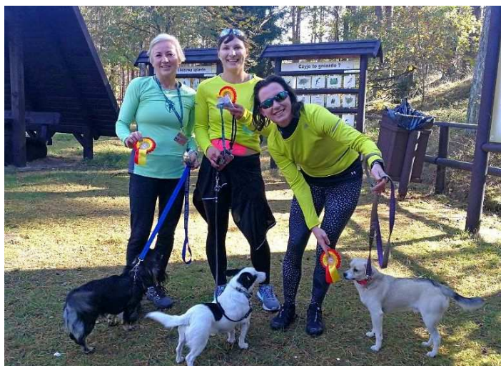
Uczestnicy III Zachodniopomorskiego DogTrekkingu