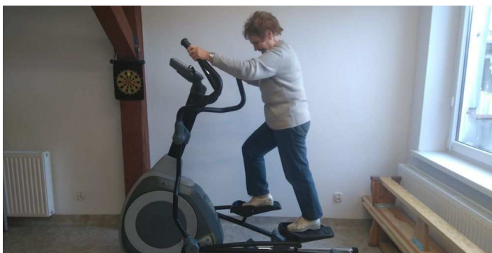
Nowy orbiterek w Klubie Senior+

Dodatkowo, od niedawna posiadamy nowy sprzęt do ćwiczeń - orbitreka. Jest to trenażer eliptyczny Crosstrainer firmy Kettler (koło zamachowe 18 kg), bardzo płynne ruchy, nie obciążające stawów. Serdecznie zapraszamy do naszego klubu, na pewno poprawisz swoją kondycję w przyjaznej atmosferze.