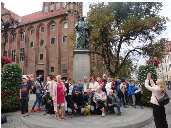
Czaplineccy diabetycy w Toruniu

Chcemy poinformować, że sponsorem sprzętu do badań jest KABEL-TECHNIK POLSKA, a materiałów w tym pasków testowych firma RIMASTER CZAPLINEK.