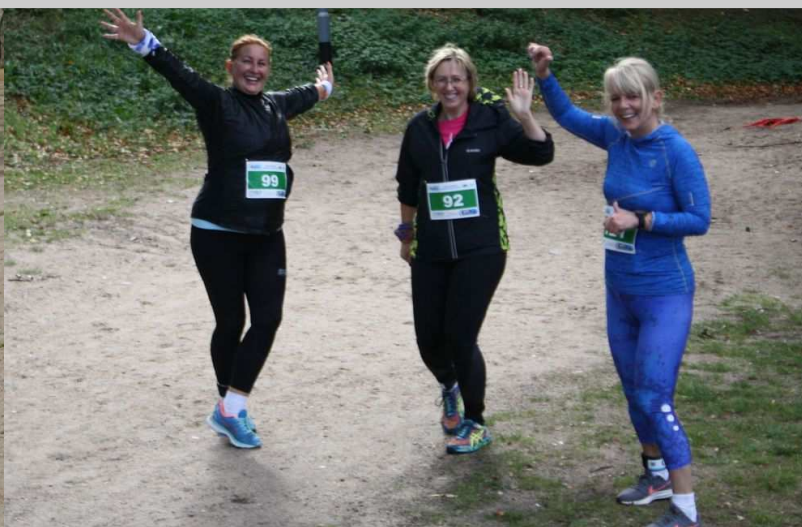
Zawodników nie opuszczał dobry nastrój