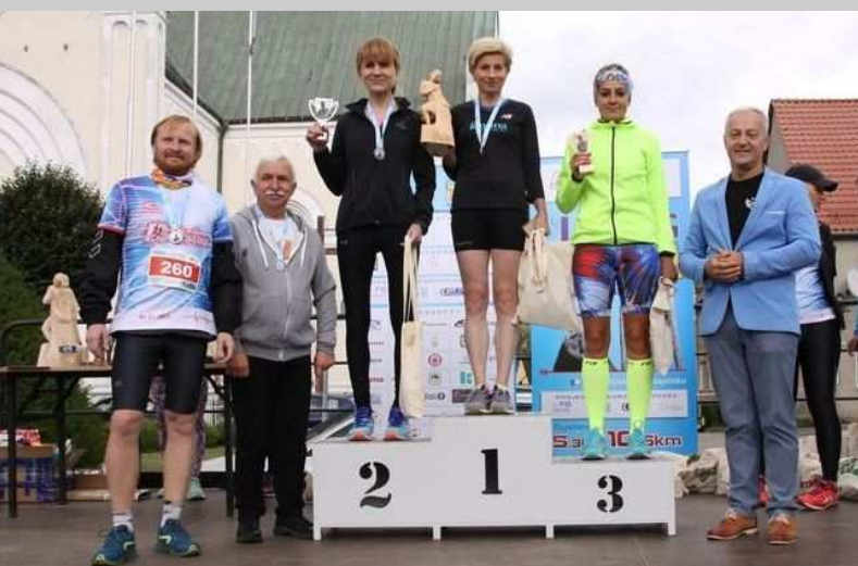
Najlepsze zawodniczki na dystansie 5 km