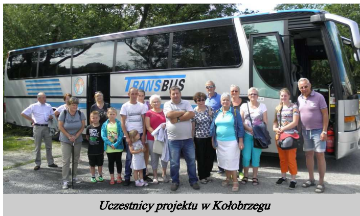
Uczestnicy projektu w Kołobrzegu

Zorganizowano i przeprowadzono konkurs pn. „Wiedza o Stuleciu Polski”. Uczestnicy odpowiadali na pytania dotyczące wiedzy o historii Polski. Pytania zostały ułożone przez miejscowego historyka. Dla dzieci zorganizowano gry i zabawy o tematyce niepodległościowej. Najlepsi zostali wynagrodzeni drobnymi podarunkami.