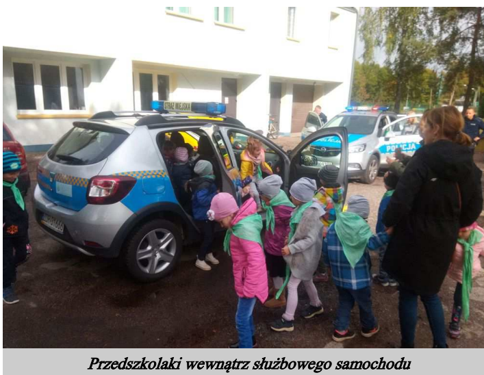
Przedszkolaki wewnątrz służbowego samochodu

2 października br. Komendant Policji w Czaplinku wspólnie z Komendantem Straży Miejskiej gościł na terenie komisariatu przedszkolaki z Niepublicznego Przedszkola Sióstr Salezjanek. Funkcjonariusze odpowiadali na liczne pytania dzieci na temat charakteru pracy obydwu służb jak i różnic między nimi. Odbyła się także prezentacja wyposażenia osobistego funkcjonariuszy, a ponadto można było wejść do służbowych samochodów.