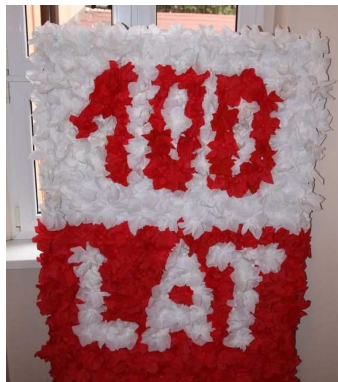
Tablica w Urzędzie Miejskim

Szkoła Podstawowa w Czaplinku wystąpiła z propozycją uczczenia 100 rocznicy odzyskania niepodległości przez Polskę poprzez symboliczne podkreślenie tego ważnego wydarzenia na terenie czaplineckich zakładów pracy. Celem przedsięwzięcia jest przypomnienie Polakom o poświęceniu, jakie ponieśli nasi przodkowie, abyśmy my mogli żyć w wolnym kraju.