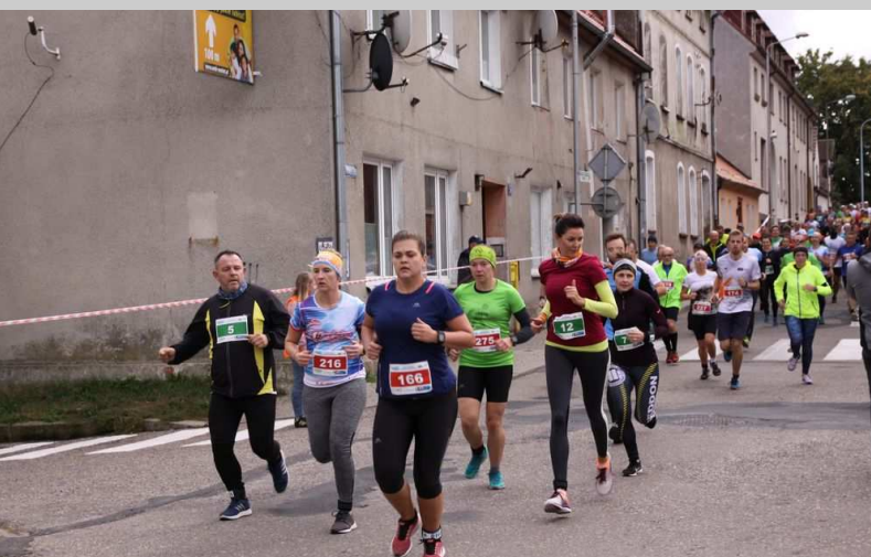
Początek trasy - ul. Moniuszki