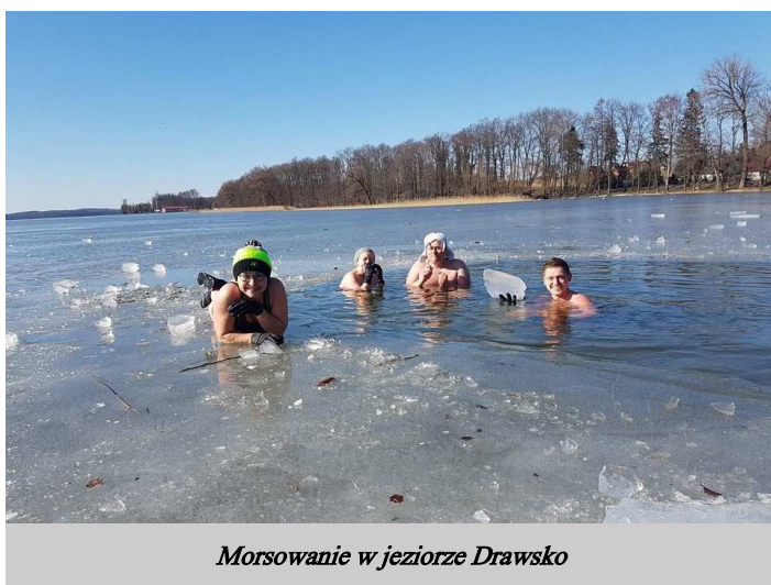
Morsowanie w jeziorze Drawsko

Morsowanie powoduje wydzielanie w organizmie endorfin - substancji odpowiedzialnych za odczuwanie przyjemności.