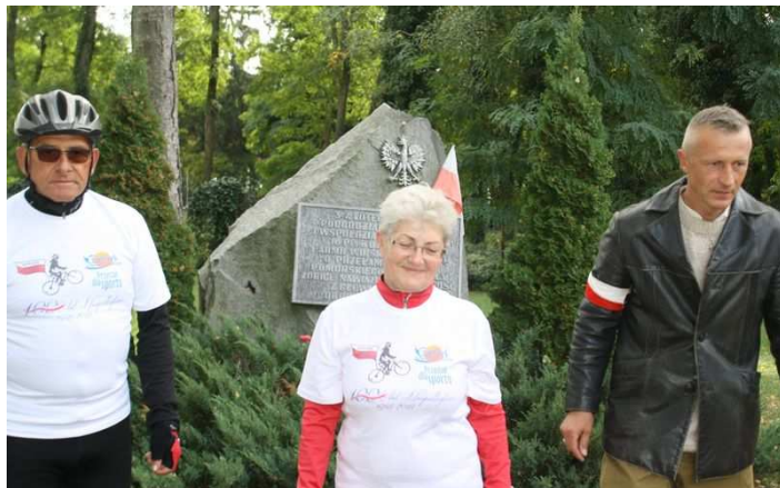
Na trasie pod pomnikiem pamięci