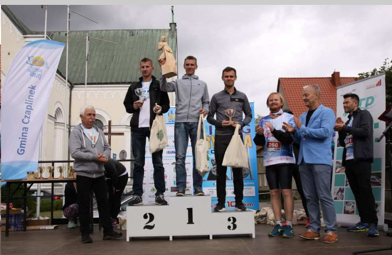
Zwycięzcy na dystansie 10 km