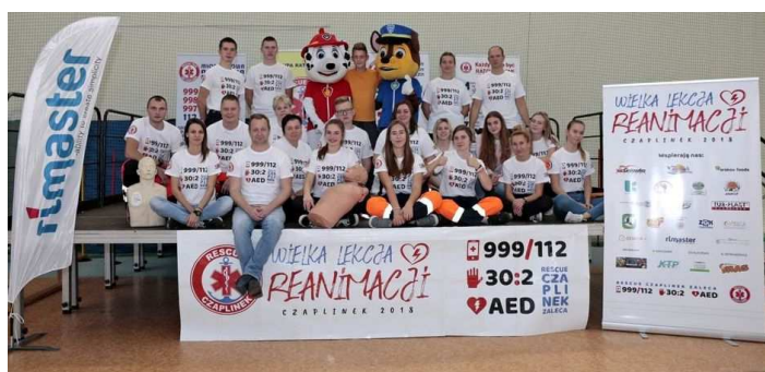
Czaplinecka ekipa Rescue

16. października to Europejski Dzień Przywracania Czynności Serca. Z tej okazji licealiści z grupy RESCUE CZAPLINEK postanowili zorganizować Wielką Lekcję Reanimacji . W ciągu 7 godzin halę widowiskowo-sportową w Czaplinku odwiedziło łącznie 1136 osób, w tym uczniowie szkoły podstawowej, szkół ponadgimnazjalnych, wychowanki MOW, przedszkolaki oraz seniorzy. Uczestnicy Wielkiej Lekcji Reanimacji trenowali pod czujnym okiem instruktorów ocenę stanu poszkodowanego, uciskanie klatki piersiowej oraz obsługę defibrylatora AED. Dzięki zaangażowaniu wielu osób prywatnych, firm i instytucji możliwy był zakup szkoleniowego AED, długopisów, koszulek, dyplomów, cukierków oraz breloków - mini apteczek, które otrzymali wszyscy uczestnicy wydarzenia. Wielką atrakcją dla dzieci była obecność bohaterów z bajki Psi Patrol.