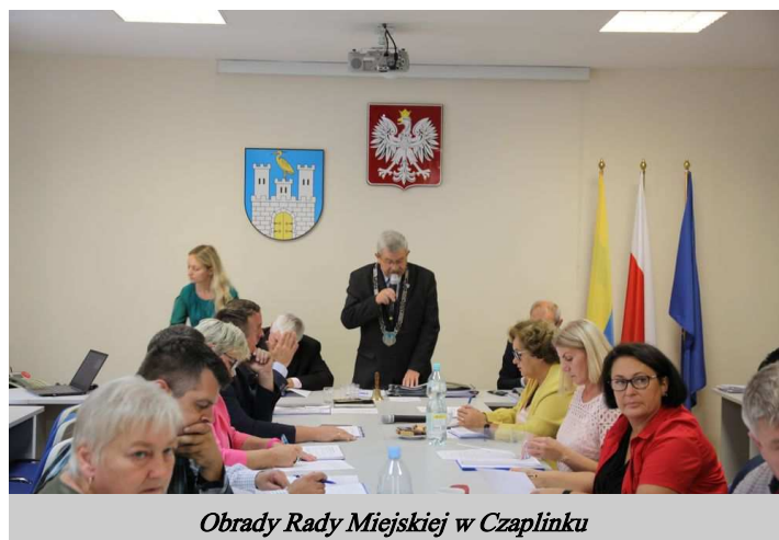
Obrady Rady Miejskiej w Czaplinku

12) uchwałę w sprawie wydzierżawienia na czas nieoznaczony nieruchomości stanowiących własność Gminy Czaplinek - podjęto 11 głosami „za” w obecności 11 radnych;