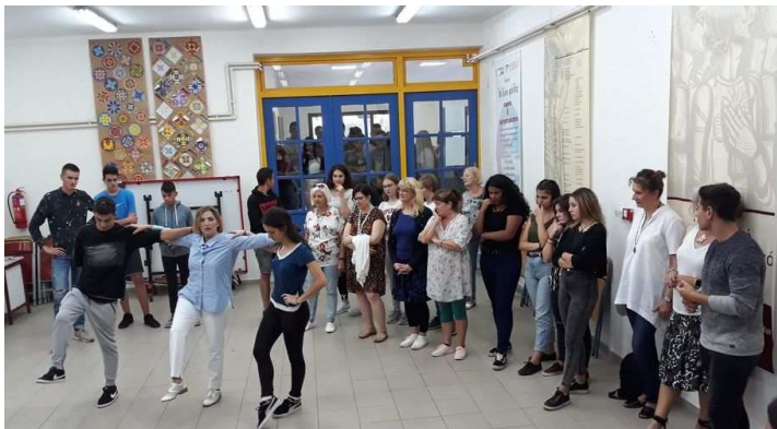
Zajęcia integracyjne w greckiej szkole

Nie zabrakło spacerów urokliwymi uliczkami nadmorskich miasteczek zatoki Pagasyjskiej oraz podziwiania malowniczej architektury Kalambaki, Milies i Kato Gatzea.