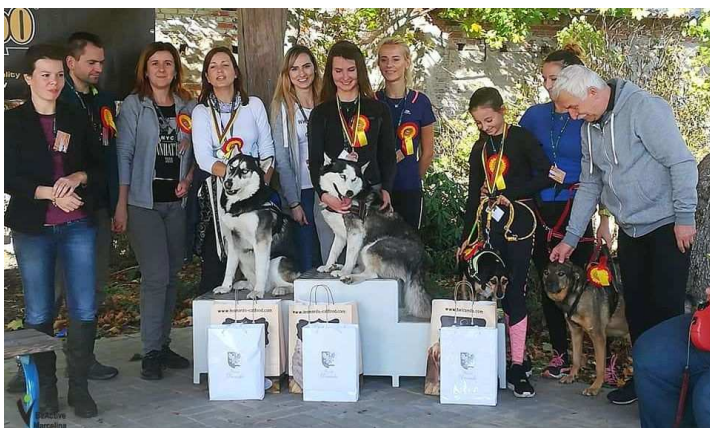
Zwycięzcy III Zachodniopomorskiego DogTrekingu