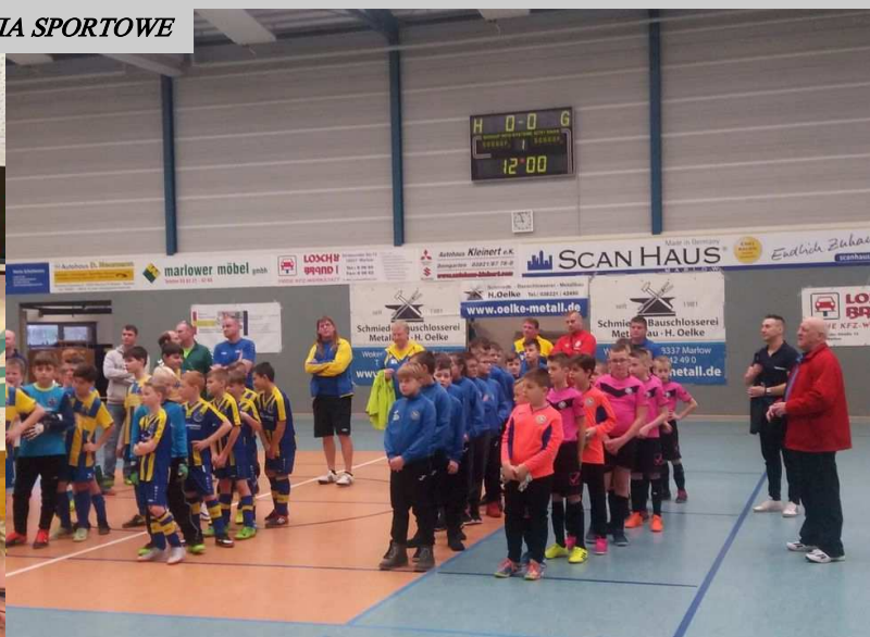
Młodzi zawodnicy KS IRAS na turnieju w Marlow