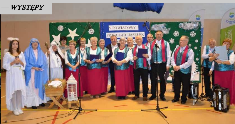
Zespół „La Bazuna” na Powiatowym Przeglądzie Kolęd i Pastoralek