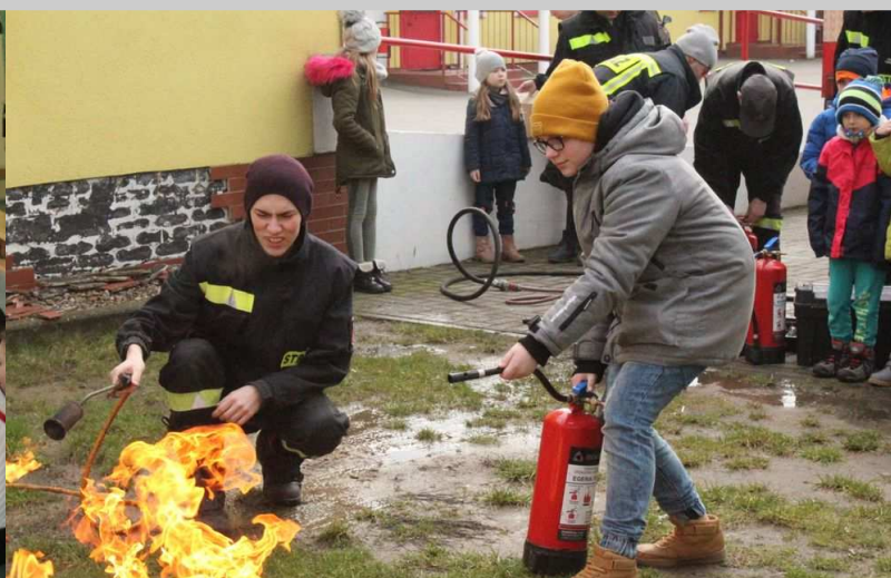
Spotkanie ze strażakami