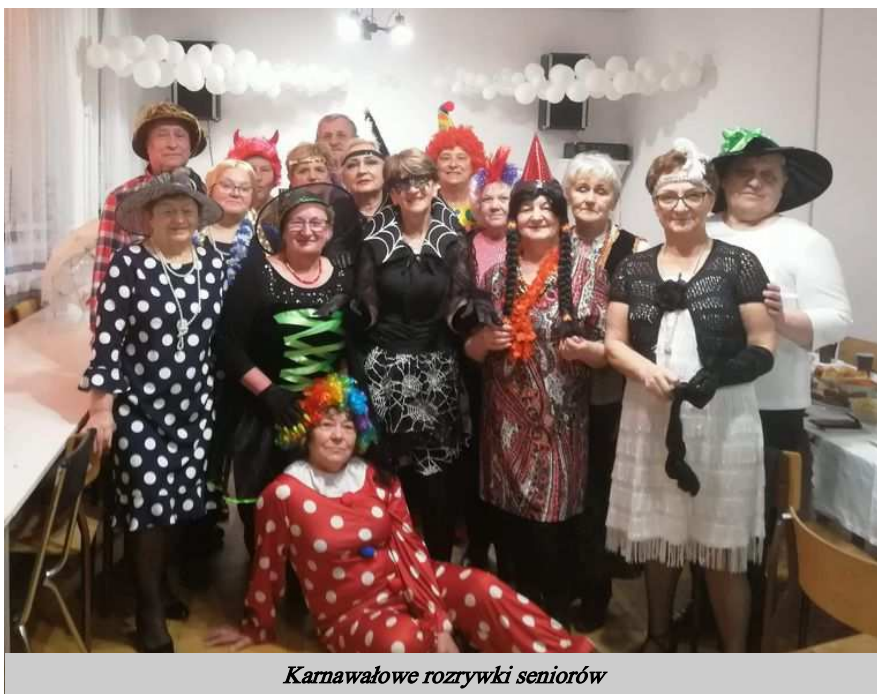
Karnawałowe rozrywki seniorów

W Klubie jest czas na zabawę oraz na integrację międzypokoleniową z zaprzyjaźnionym Niepublicznym Przedszkolem Sióstr Salezjanek.