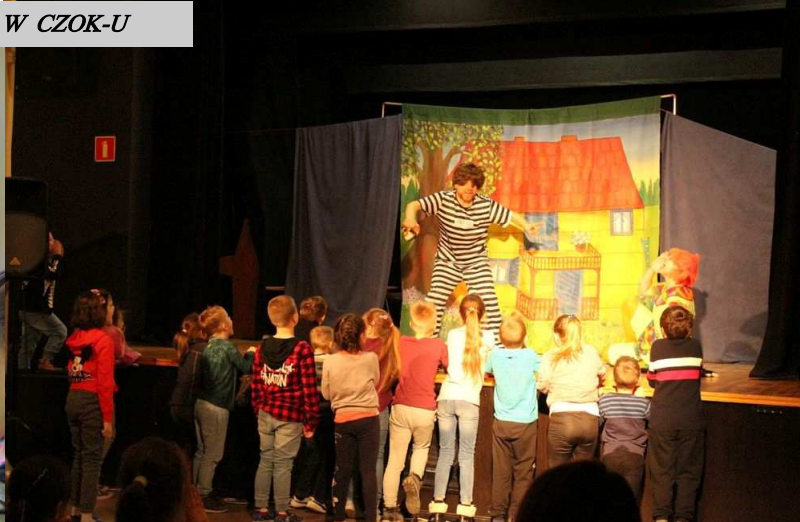
Spektakl „Pipi Skarpetka”