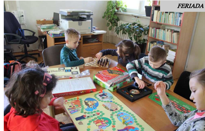
Planszówki w bibliotece