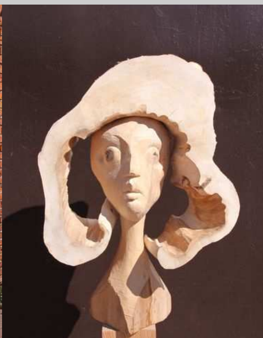
Głowa barokowej damy