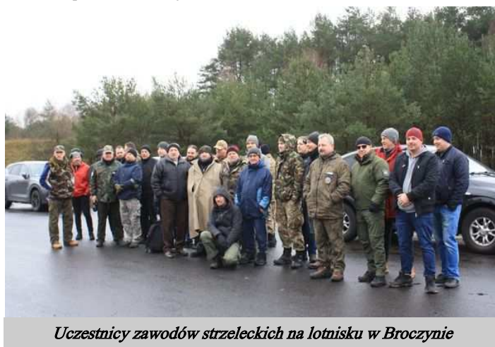
Uczestnicy zawodów strzeleckich na lotnisku w Broczynie