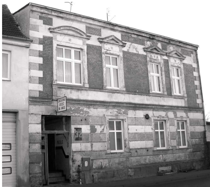
Współczesny wygląd budynku „Meduzy” z 2011 roku

Szcześliwcom udawało się nieraz - przeważnie podczas tanga - namówić partnerkę do odprowadzenia jej po dancingu do domu. Odprowadzanie było okazją, by skraść dziewczynie całusa. Ale zdarzały się również takie niespodzianki, jaka spotkała kiedyś dwóch kawalerów, którzy namówili na odprowadzenie do domu dwie nowo poznane panny. Dopiero w trakcie odprowadzania okazało się, że dziewczyny mieszkają kilka kilometrów za miastem. Chłopcy honorowo odprowadzili obie panny pod ich domy w pobliskiej wiosce, ale później już zawsze w podobnych sytuacjach - zanim zaproponowali odprowadzenie - najpierw pytali poznane dziewczyny o to, gdzie mieszkają. Opisane wyżej kawalerskie harce kończyły się przeważnie z chwilą, gdy młodzieniec zaczął "chodzić" z jakąś dziewczyną. Takie "chodzenie" kończyło się różnie. Nieraz był to tylko kilkutygodniowy romans, a nieraz znajomość taka prowadziła do ślubu. Po ślubie młodzi przeważnie w dalszym ciągu pozostawali by-