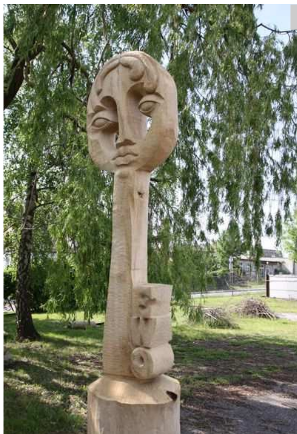
Witacz - Kluczewo