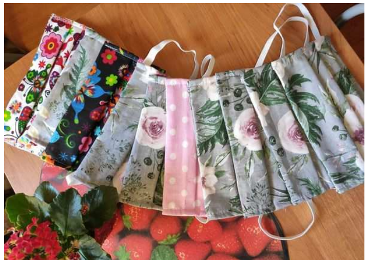
Maseczki wykonane przez jedną z mieszkank Czarnego Małego