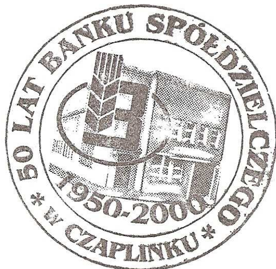
Pieczęć okolicznościowa z 2000 roku (proj. Grażyna Warsińska i Ireneusz Grzyb)

Łączące się banki otrzymały status oddziałów Pomorskiego Banku Spółdzielczego. Jednoczesne połączenie się aż sześciu banków spółdzielczych było prawdopodobnie wydarzeniem bez precedensu w całych powojennych dziejach polskiej spółdzielczości bankowej.