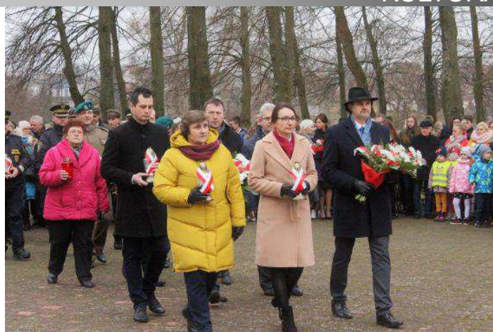
Delegacja Gminy Czaplunek