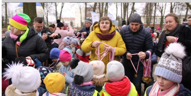
Pamiątkowe medale otrzymują przedszkolaki.