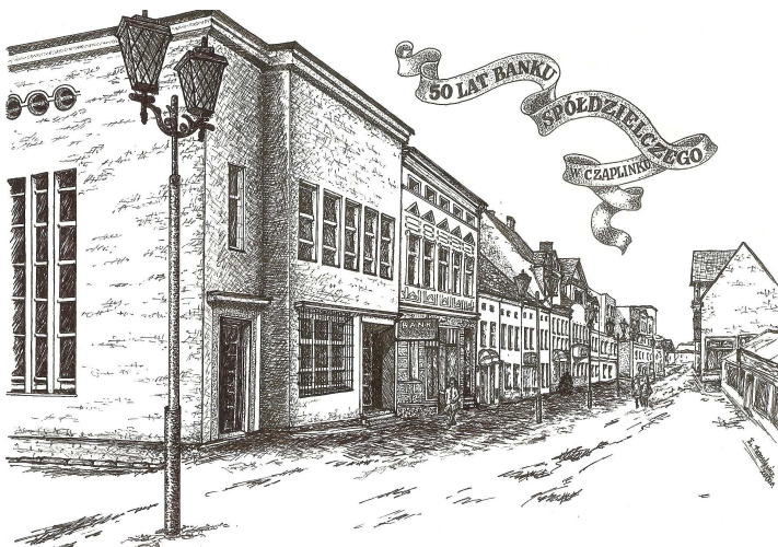
Grafika z 2000 roku autorstwa Ewy Tamulewicz, wykonana w ramach obchodów 50-lecia czaplunckiego Banku Spółdzielczego.