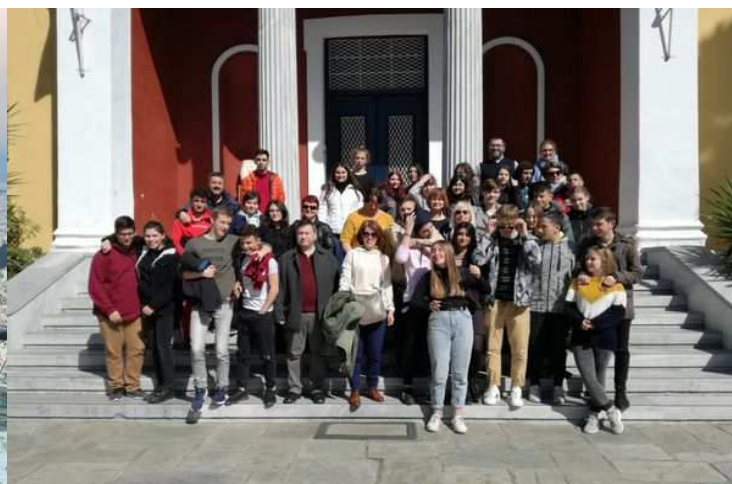
Pamiątkowe zdjęcia z pobytu w Grecji

Program pobytu szkół partnerskich w Grecji był niezwykle atrakcyjny. Gospodarze zorganizowali minikonferencję, której tematem przewodnim była reklama, proces jej tworzenia, etyka jako element kluczowy w przekazie treści reklamowanej oraz dostosowywanie jej do współczesnego odbiorcy. Uczniowie i nauczyciele zapoznali się z systemem edukacyjnym w Grecji i historią okolic Agrii. Wzięli udział w zabawach integracyjnych połączonych z nauką tradycyjnego tańca greckiego. Nauczyciele przeprowadzili zajęcia artystyczne, debatę oksfordzką dotyczącą etyki w reklamie oraz dyskusję na temat przykładowych reklam z krajów partnerskich.