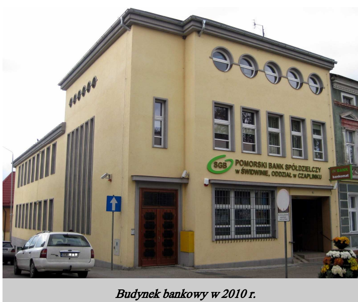
Budynek bankowy w 2010 r.