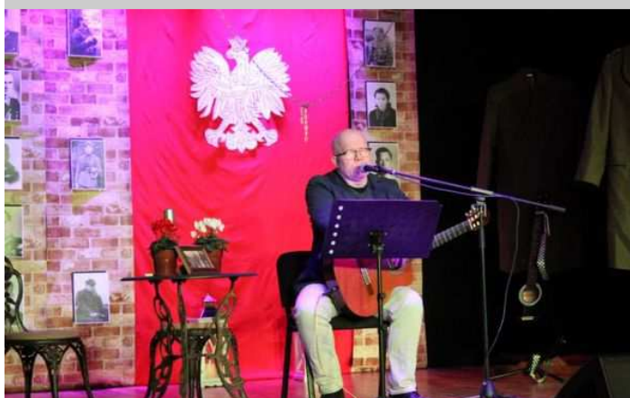
Cześć artystyczna - koncert Andrzeja Kołakowskiego