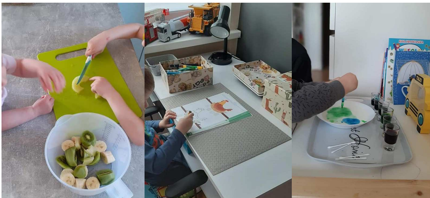
Prace wykonywane w domu przez wychowanków przedszkola

dyrektor Niepublicznego Przedszkola Sióstr Salezjanek w Czaplunku