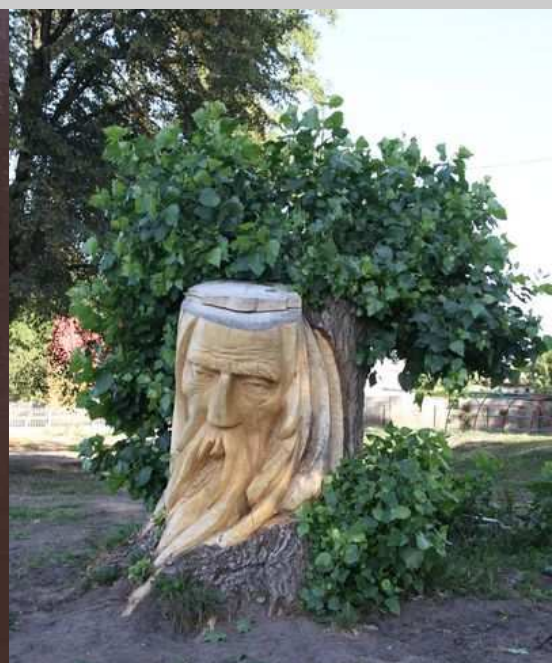
Wodnik nad jeziorem Drawsko