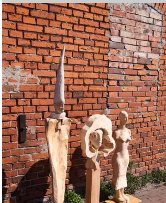
Najnowsze prace Edwarda Szatkowskiego