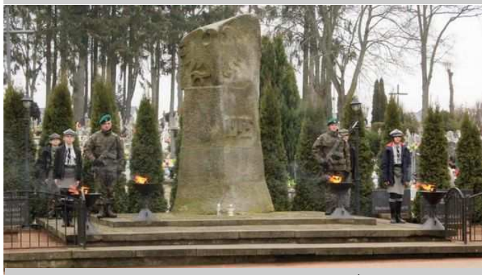
Warta żołnierzy i harcerzy przy Grobie Żołnierza