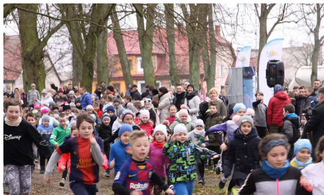
Uczestnicy biegu - uczniowie szkoły podstawowej.