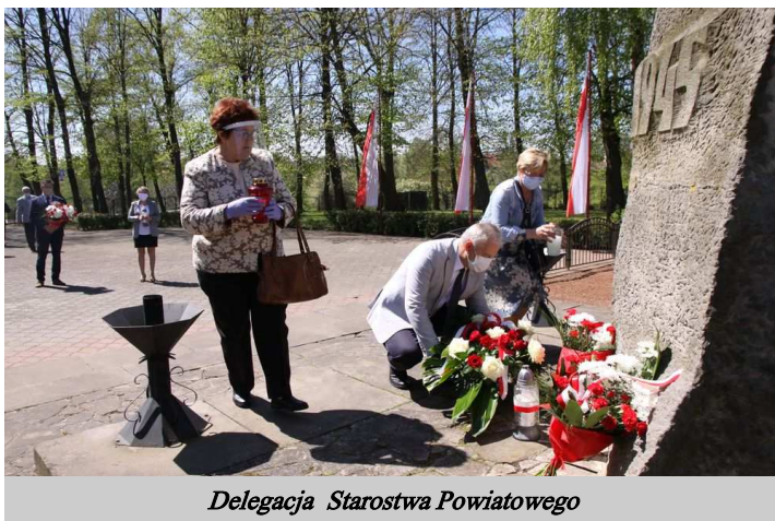
Delegacja Starostwa Powiatowego

8 maja 2020 r. obchodzony był Narodowy Dzień Zwycięstwa. Tym razem bardzo nietypowy, bez uroczystości, apelu i zgromadzeń, ale niezmiennie w zadumie i z pamięcią.