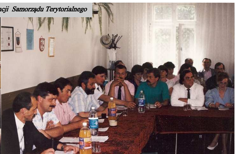
II Kadencja 1994 - 1998