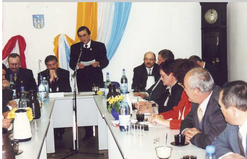
III Kadencja 1998 - 2002