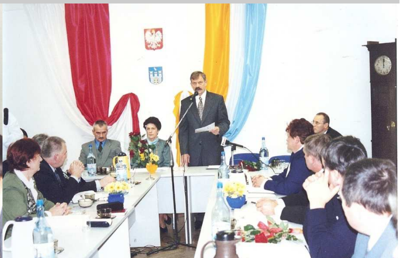
IV Kadencja 2002 - 2006