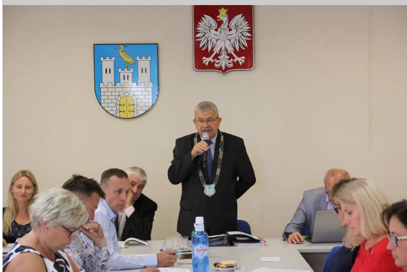
VII Kadencja 2014 - 2018