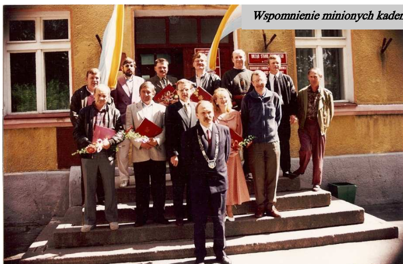
I Kadencja 1990 - 1994