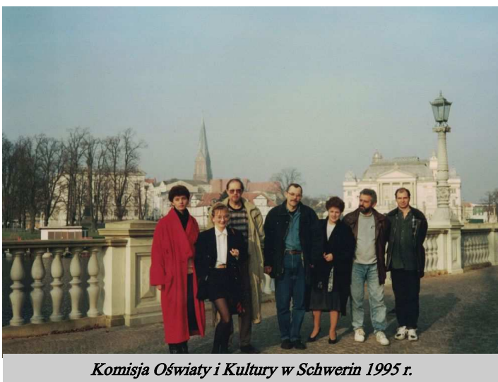
Komisja Oświaty i Kultury w Schwerin 1995 r.