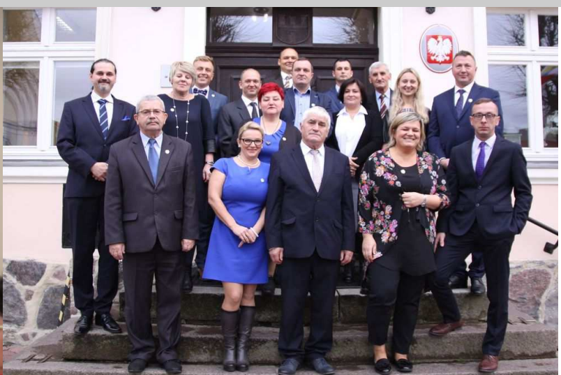
VIII Kadencja 2018 - 2023