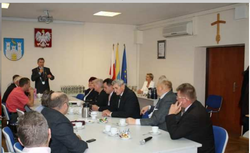
VI Kadencja 2010 - 2014