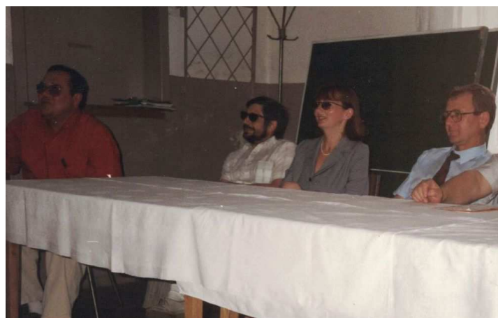
Posedzenie Zarządu Miasta i Gminy - Czarne Wielkie