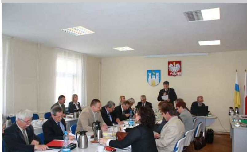
V Kadencja 2006 - 2010