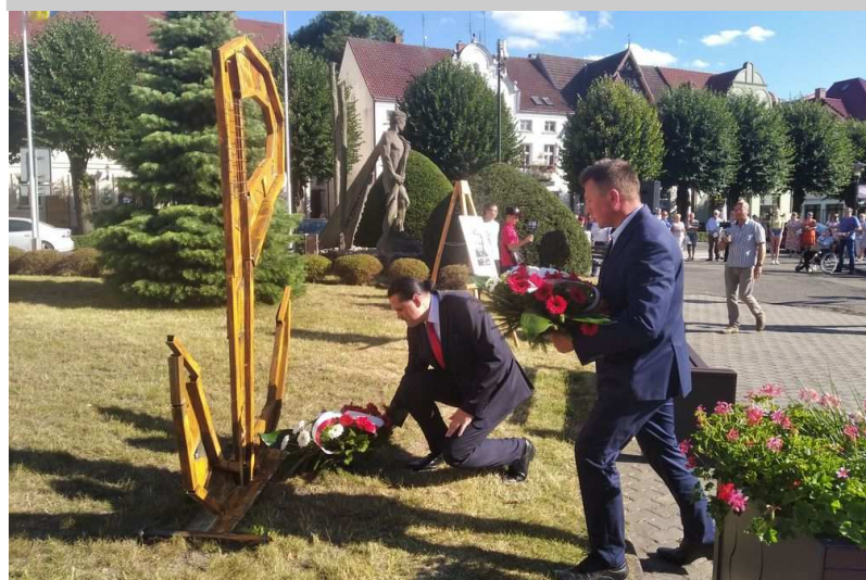
Narodowy Dzień Pamięci Powstania Warszawskiego