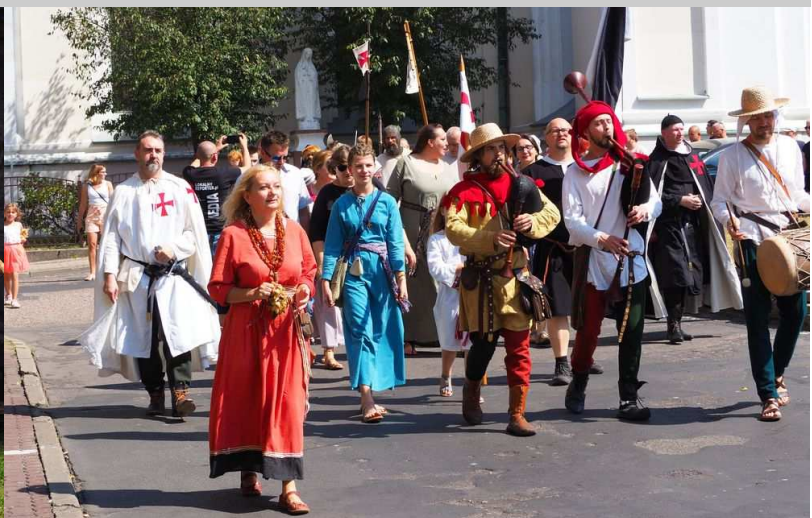
II Piknik Średniowieczny w Czaplisku