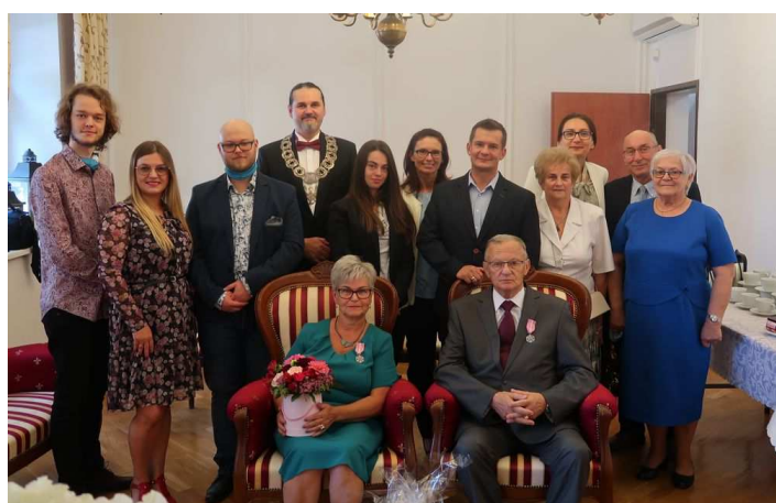
Jubileusz Państwa Atraszkiewiczów