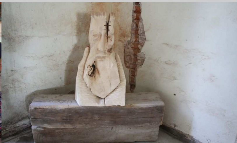
III Międzynarodowy Plener Artystyczny - praca Edwarda Szatkowskiego