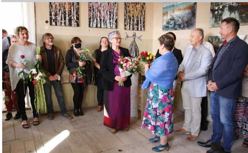
III Międzynarodowy Plener Artystyczny w Siemczynie