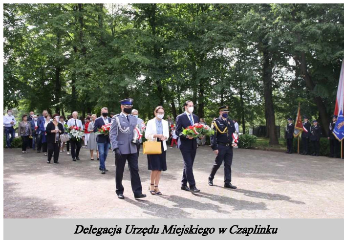
Delegacja Urzędu Miejskiego w Czaplisku

81 lat temu rozpoczęła się II Wojna Światowa. W piątkowy poranek, 1 września 1939 roku o godz. 4.45, niemiecki pancernik "Schleswig-Holstein" zaatakował Westerplatte. Tak rozpoczął się największy konflikt w historii ludzkości. Tego samego ranka wojska niemieckie - bez wypowiedzenia wojny - zaatakowały Polskę na całej długości zachodniej granicy oraz terytorium Moraw i Słowacji. Atak wspomagany był nalotami bombowymi Luftwaffe, a prawdopodobnie pierwszym zbombardowanym miastem był Wieluń.