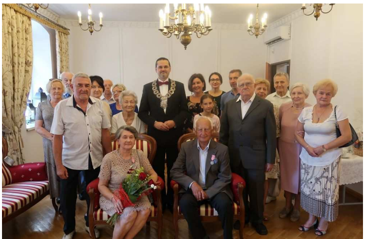
Jubileusz Państwa Daniuków