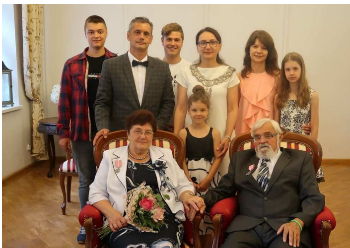
Jubileusz Państwa Polaków