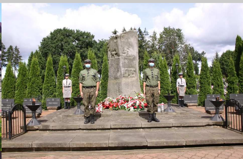
81. rocznica wybuchu II Wojny Światowej