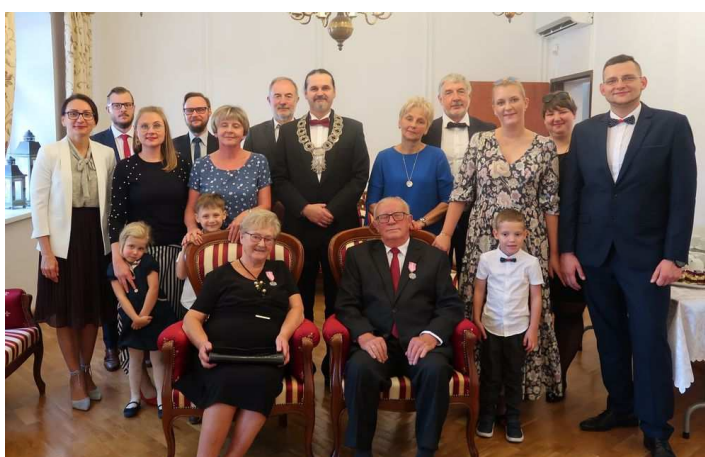
Jubileusz Państwa Kempieńskich