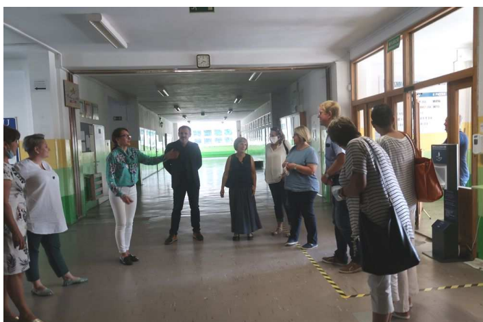
Spotkanie robocze w Szkole Podstawowej w Czaplinku

Ochotnicza Straż Pożarna w Siemczynie na działanie „Szkolenie pod chmurką”;