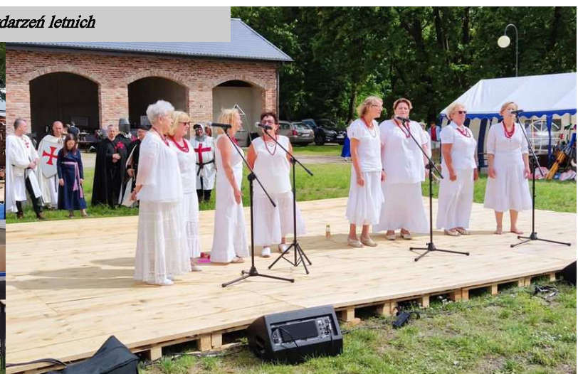
XVII Henrykowskie Dni w Siemczynie - występ zespołu „Dawna Śpiewka”