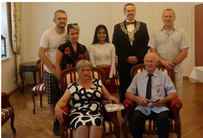
Jubileusz Państwa Dziewierskich