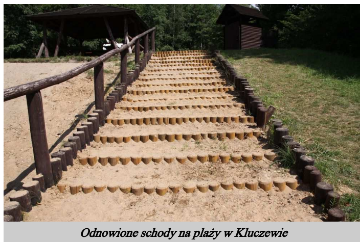
Odnowione schody na plaży w Kluczewie

Wydatek związany z wykonaniem remontów i oznakowania to kwota ponad 50 tys. zł.