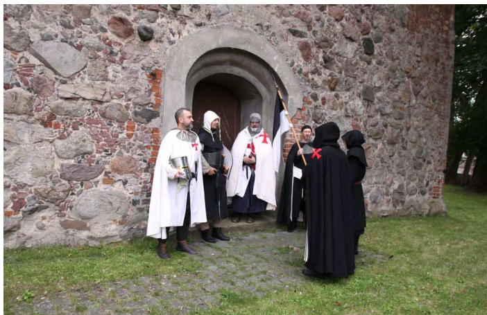
Zdjęcie z planu filmu promocyjnego

- dofinansowanie na wsparcie działań promocyjnych, w ramach którego powstanie film promocyjny „Miasteczko templariuszy”, opowiadający o miejscach na terenie gminy, związanych z założeniem w Czaplunku komandorii Tempelburg i obecnością na tym terenie zakonu templariuszy (całkowity koszt realizacji filmu: 3500,00 zł, dofinansowanie ZROT 1750,00 zł).