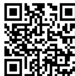
„Marzenie starego komandora”