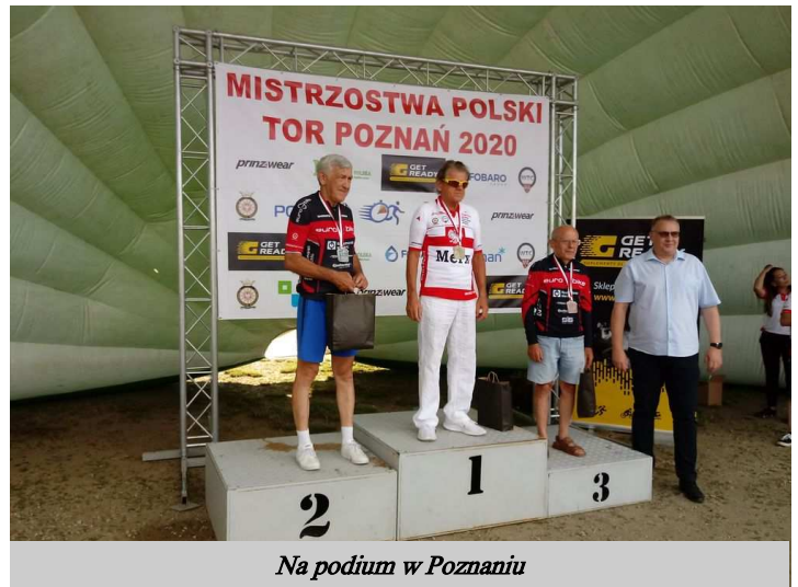
Na podium w Poznaniu

Jak widać, to nie zawsze zajęte miejsce daje satysfakcję zawodnikowi, ale dyspozycja i praca wykonana podczas wyścigu.