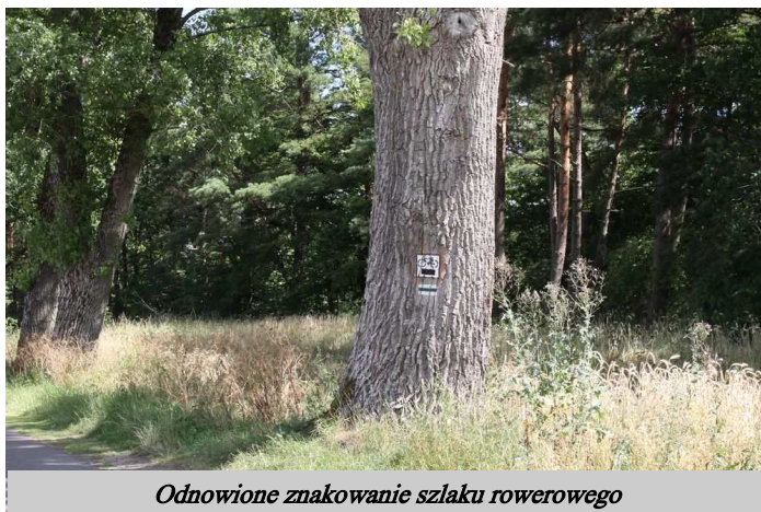
Odnowione znakowanie szlaku rowerowego

Miło nam poinformować, że w połowie lipca br. zakończyły się prace remontowe małej infrastruktury w miejscach turystyczno-rekreacyjnych na terenie gminy Czaplinek.