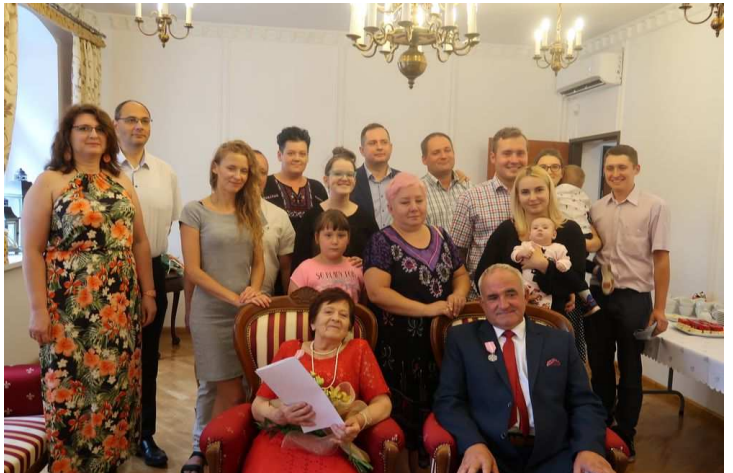
Jubileusz Państwa Hałuszczaków