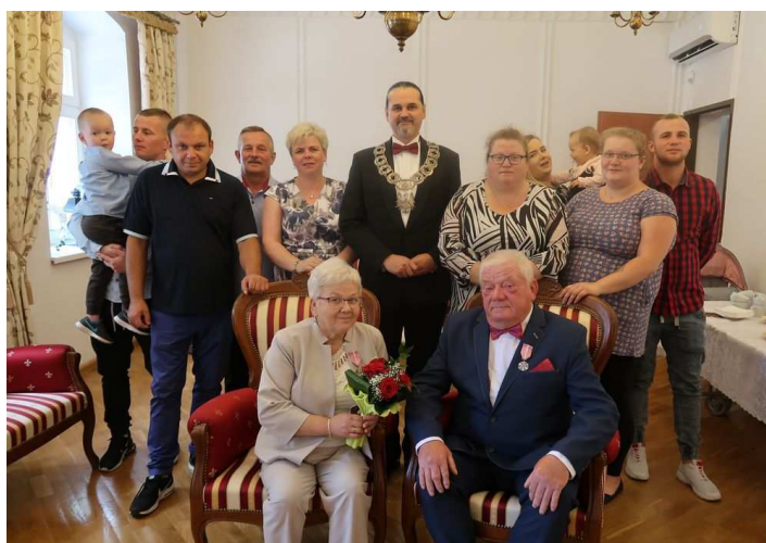
Jubileusz Państwa Siekierów