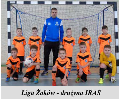
Liga Żaków - drużyna IRAS