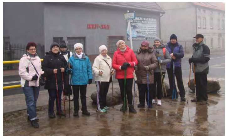
Pamiątkowe zdjęcie uczestników marszu tuż przed startem