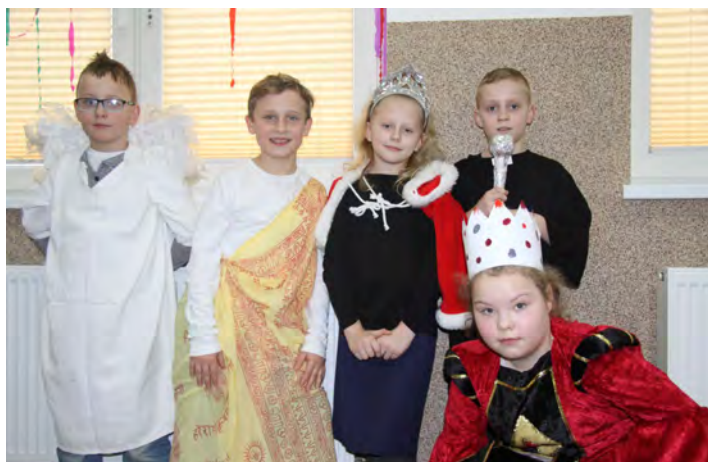
Dzieci na Balu Świętych

W czasie wypoczynku uczestnicy poznawali życiorysy różnych świętych, którzy są ich patronami lub są szczególnie z nimi związani. Ostatniego dnia, z okazji karnawałowego Balu Świętych, dzieci miały za zadanie przebrać się za te postacie.