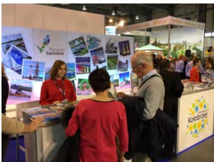
Zwiedzający stoisko Czaplina

Gmina Czaplinek, by zachęcić do odwiedzenia naszych regionów, w dniach 17-19 lutego br. uczestniczyła w targach turystycznych Tour Salon w Poznaniu. W stolicy wielkopolski promowała się na stoisku Zachodniopomorskiej Regionalnej Organizacji Turystycznej wspólnie z Lokalną Organizacją Turystyczną Czaplinek i Lokalną Organizacją Turystyczną Pojezierza Drawskiego w Złocieniu.