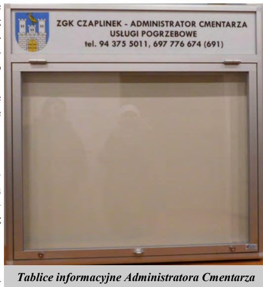
Tablice informacyjne Administratora Cmentarza

Przy wejściach głównych na teren cmentarza montowane są przez Administratora Cmentarzy Komunalnych