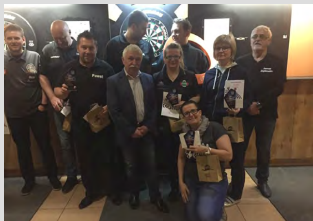
Zawodnicy Steel Darta z burmistrzem Czaplunku