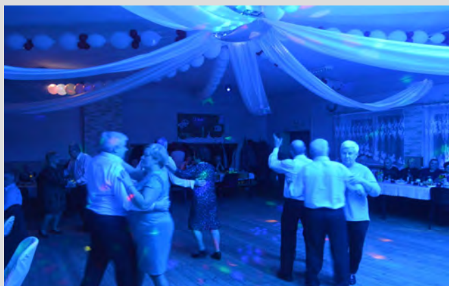
Seniorzy podczas Balu Seniora