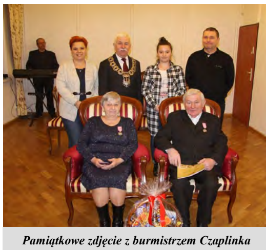
Pamiątkowe zdjęcie z burmistrzem Czaplinka

Z tym większą radością składamy Państwu z tej właśnie okazji najserdeczniejsze życzenia szczęścia oraz wszelkiej pomyślności w dalszym wspólnym życiu, abyście w zdrowiu, otoczeni ludźmi, których kochacie, doczekali kolejnych wspólnych rocznic.