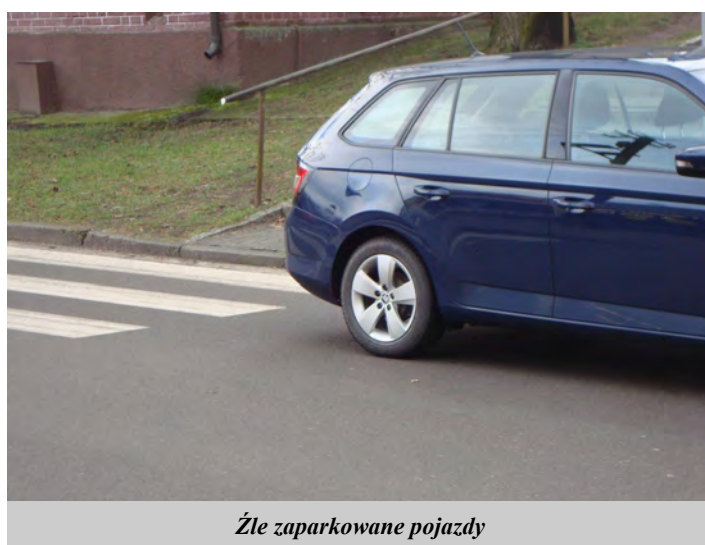
Źle zaparkowane pojazdy

Przypominamy, że w ubiegłym roku Straż Miejska w Czaplinku ujawniła 410 nieprawidłowości w parkowaniu pojazdów. Dzięki tym działaniom sytuacja dotycząca parkowania pojazdów zwłaszcza w pobliżu przejść dla pieszych uległa poprawie.