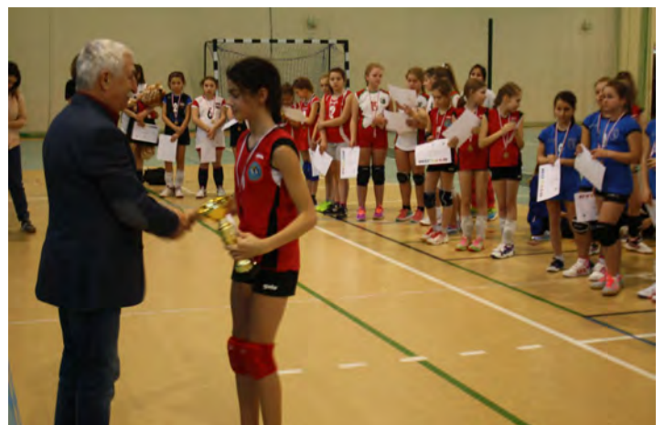
Turniej singli - puchar dla drużyny z Czaplunku