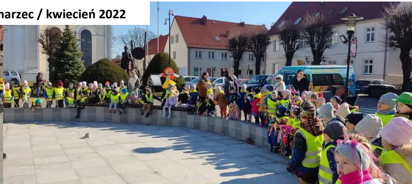
Dzieci z Przedszkola Publicznego w Czaplunku witają wiosnę