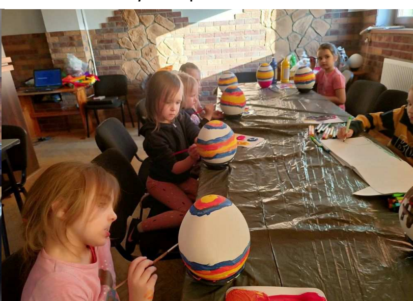
Zajęcia w Czaplinceckim Ośrodku Kultury: Warsztaty z Brzechwą i Warsztaty Wielkanocne