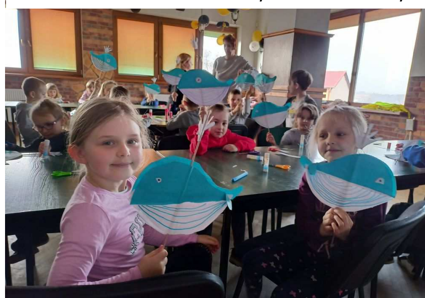
Światowy Dzień Świadomości Autyzmu w Przedszkolu Publicznym w Czaplunku