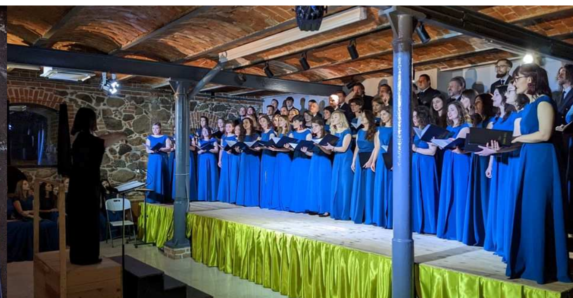
50. Henrykowskie Spotkania Kulturalne w Siemczynie