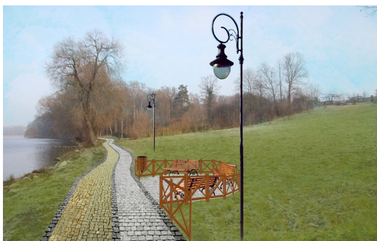
Fot. 4 – Wizualizacja ścieżki z kostki szlachetnej – 2012 r.