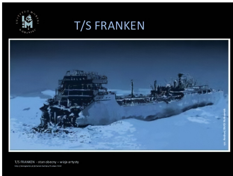
T/S FRANKEN - stan obecny - wizja artysty fot. J. Antoniewicz, ul. 29, Naroki Bałtyk, T. Franken, 2014

W głębi Zatoki Gdańskiej jest zatopionych około 70 tys. ton różnej amunicji, broni chemicznej zamieniającej się w toksyczną około 15 tys. ton bojowych środków trujących. Niektóre z tych środków nie wiemy, gdzie są wyrzucone. Dotyczy to bojowego środka trującego tabunu, środków fosforowych, iperytu itp. Szacuje się, że 1/6 tych trucizn zalegających na dnie Bałtyku mogłaby całkowicie zniszczyć nasze morze na całe 100 lat. W pierwszej kolejności zginęłyby ssaki morskie, wylęg i narybek ryb, całe pogłowię wszelkich zwierząt.