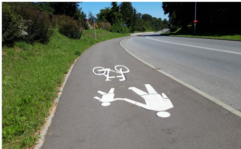
Fot. 9 – Ścieżka przy ul. Szczecineckiej – 2022 r.