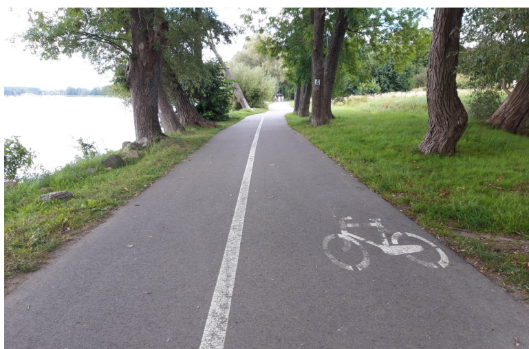
Fot. 8 – Ścieżka od pomnika papieża do amfiteatru – 2021 r.