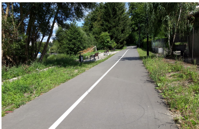
Fot. 11 – Ścieżka od parkingu do ul. Górnej – 2023 r.