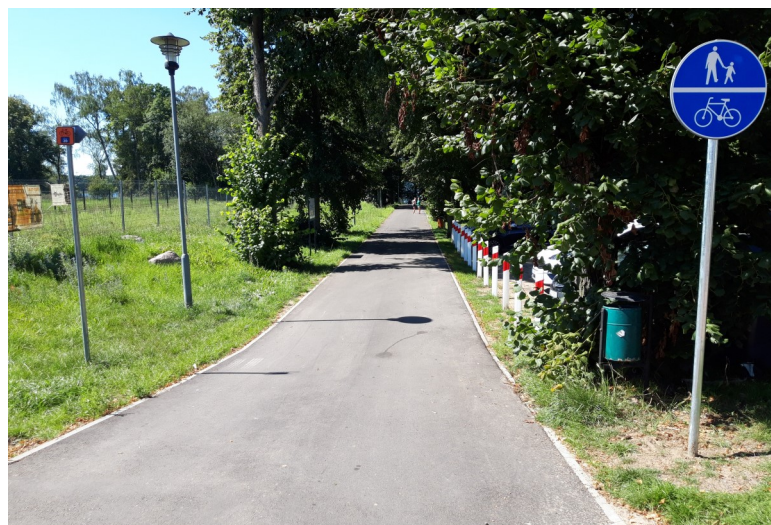
Fot. 14 – Ścieżka między ulicami Parkową i Nad. Drawskim – 2024 r.

W grudniu 2023 r. zakończono budowę ścieżki pieszo-rowerowej w ul. Nadbrzeże Drawskie na odcinkach: od parkingu przy ul. Złocienieckiej do skrzyżowania ulic Górnej i Jeziornej (fot. 11), oraz od budynku Lecha, przez plażę, do ul. Pięciu Pomostów 1b (fot. 12), o łącznej długości 1700 m. Całkowity koszt budowy wyniósł 2 470 772,45 zł, w tym udział Gminy na poziomie 352 tys. zł. Fundusze na ten cel pozyskał Związek Zachodniopomorskiej Strefy Centralnej z Programu Rządowego Fundusz Polski Ład.