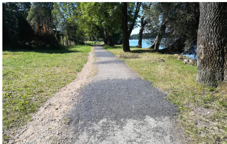
Fot. 2 – Ścieżka asfaltowa przed przebudową.