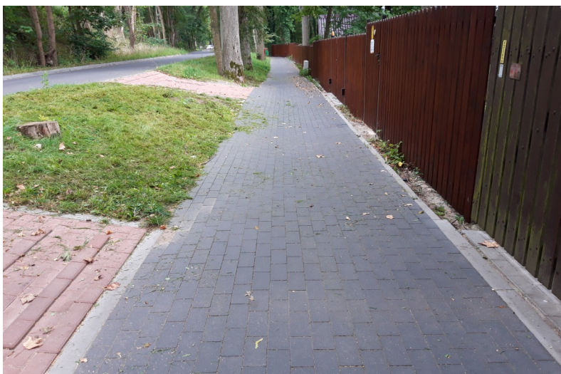
Fot. 13 – Chodnik przy ul. Pięciu Pomostów – 2023 r.