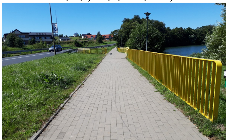
Fot. 6 – Ścieżka przy ul. Złocienieckiej – 2018 r.