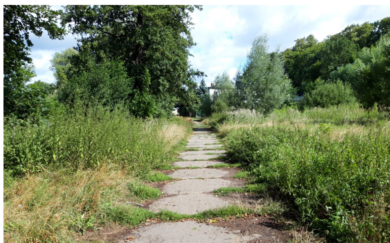
Fot. 3 – Ścieżka betonowa przed przebudową.