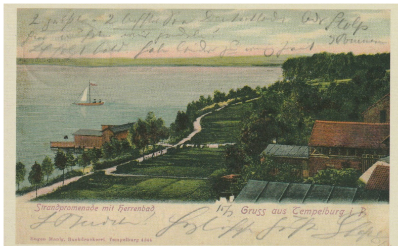
Fot. 1 – Promenada nad j. Drawsko – 1908 r.