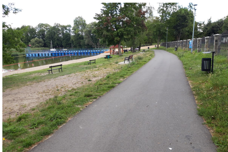
Fot. 12 – Ścieżka przy plaży miejskiej – 2023 r.