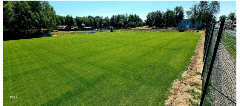
Widok na boisko boczne