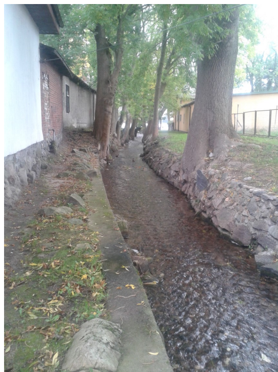
Czaplinecka Struga - 10.10.2014 r.

Zespołem wspaniałych, kolumnowych drzew są jesiony po obu stronach Czaplineckiej Strugi. Pnie drzew swymi korzeniami powrastały w kamienne umocnienia brzegów strumienia, tworząc niesamowite obrazy i przykłady funkcjonowania przyrody w różnych okolicznościach i warunkach. Jest co pokazywać i oglądać. Jednak