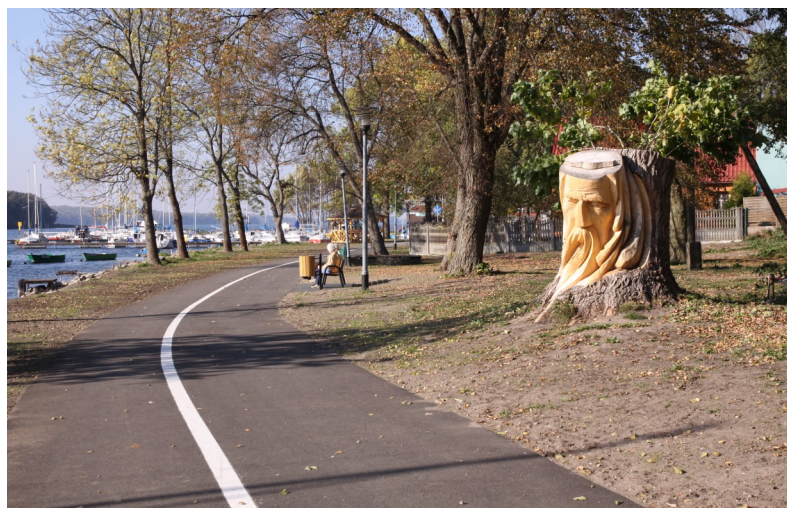
Fot. 7 – Ścieżka od ul. Jeziornej do pomnika papieża – 2018 r.