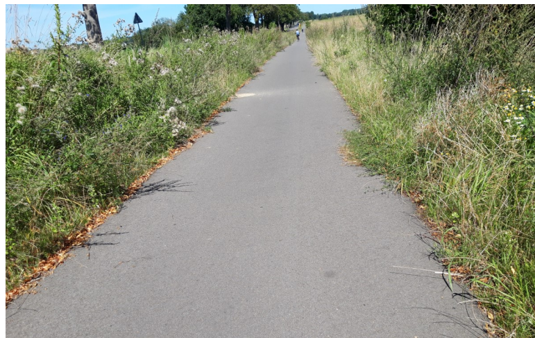
Fot. 10 – Ścieżka Czaplinek – Kołomąt – 2023 r.